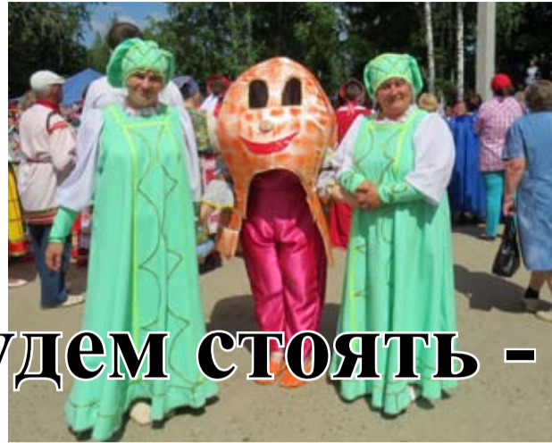
«Эх, лапти мои!»