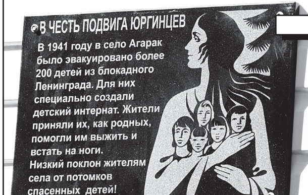
Вслед за событием

И вот настал торжественный момент – кульминация мероприятия. Красная ткань слетает с