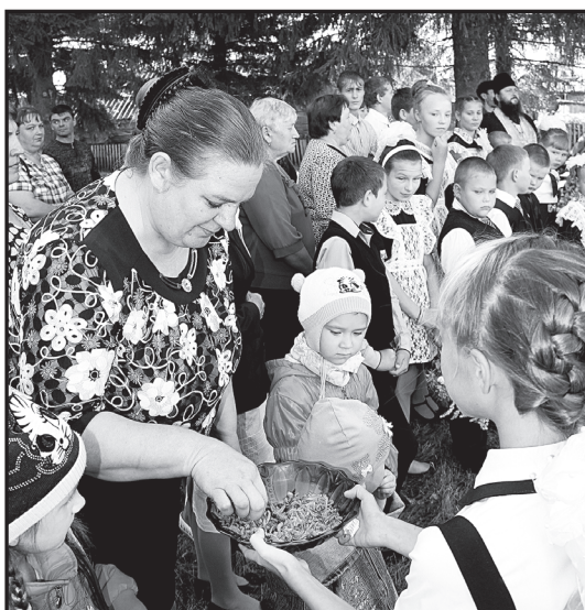
Угощение морковными парёнками