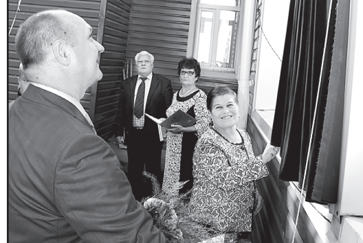
Открытие мемориальной доски