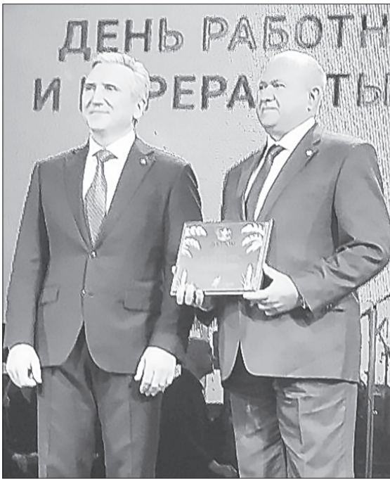
Ялutorовский район многократно становился победителем областных сельхозсоревнований