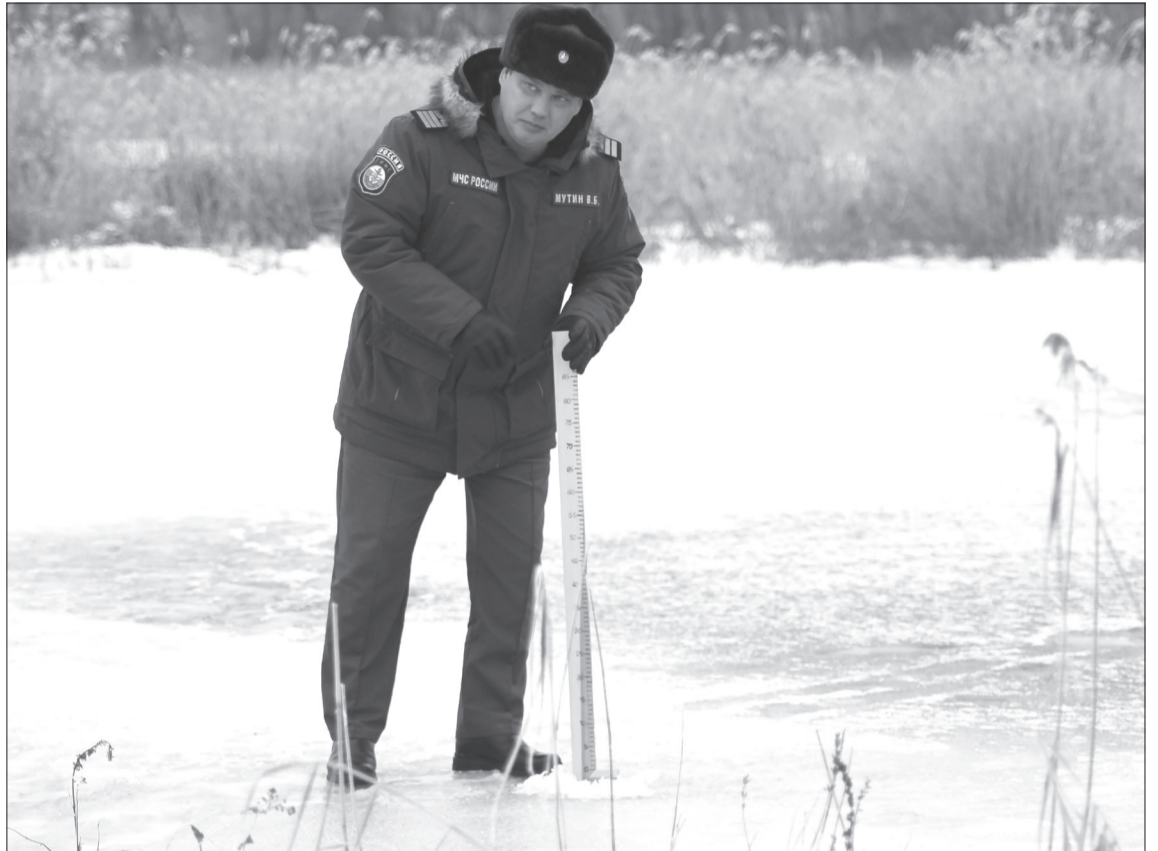
В некоторых местах даже спускаться ко льду опасно, не то что идти по нему

Таких водоёмчиков за молочным комбинатом по направлению к Тоболу считать не пересчитать. Люди не на каждом, но надо учитывать, что мы были в будний день. Машины по гололёдной грунтовке движутся почти ровно, только иногда соскальзывают в колеи. Пешком там идти