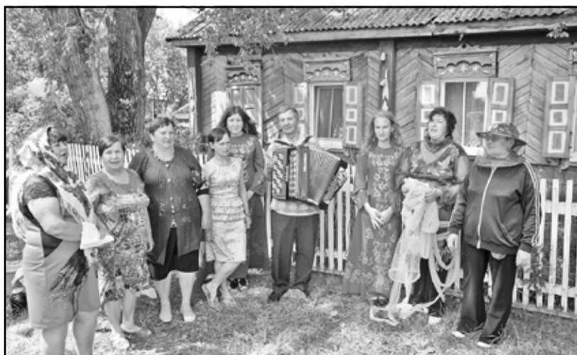
Задорные частушки жителей улицы Гагарина порадовали гостей