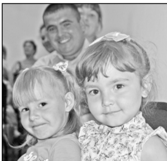
Самые юные участницы концерта

Сложно передать словами праздничную атмосферу того субботнего дня и радушие селян. Люди разных возрастов и разных судеб, простые и искренние, умеют работать с душой и отдыхать от души. Даже природа оказалась равнодушной к Челюскинцам и тоже поздравила всех проливным дождём, но не в начале, а уже почти в конце праздника.