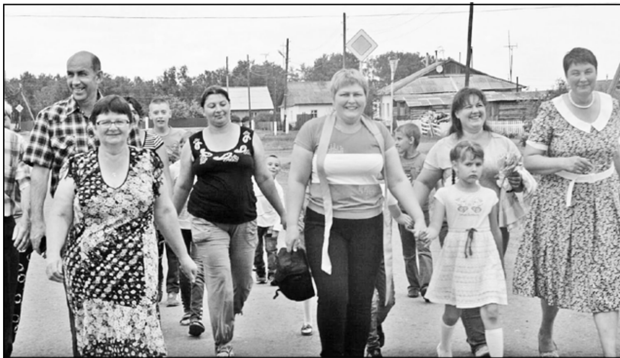
У жителей посёлка Челюскинцев сегодня – большой праздник