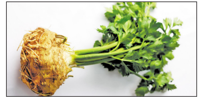
Полезность сельдерея трудно переоценить

После появления корешков начинают разворачиваться семидоли. Наступает очень ответственный момент. При малейшей пересушке почвы нежные росточки засыхают. Поливают их осторожно кипячёной водой из опрыскивателя. С этого времени лотки помещают в светлое прохладное место и устанавливают круглошуточную подсветку (в течение 3 суток). Продолжительность подсветки – с 8 до 20 часов. Подсвет-