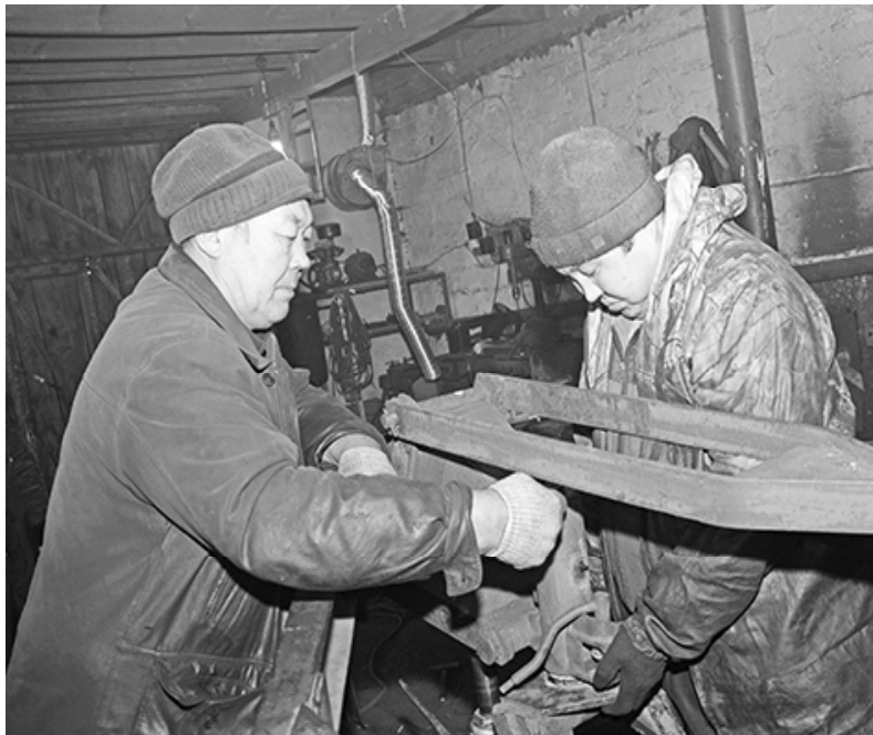
* Механизаторы КХ «Роса» за ремонтом техники