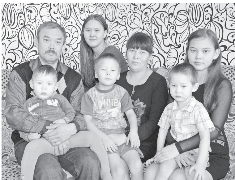
Счастливые минуты, когда все вместе!

Хочу, чтобы и мои ребятишки жили дружно, стали опорой не