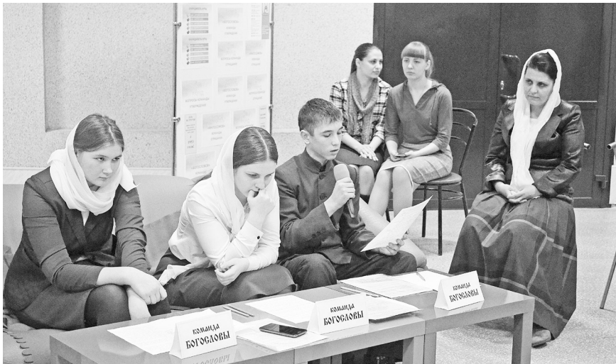
Воспитанники центра «Троица» убедительно отстаивают свою точку зрения.

Сегодня в образовательном учреждении преподают не только вероучительные дисциплины для детей в возрасте от пяти до 16 лет, но и проводят занятия по хоровому пению, этике, художественному вязанию, создают условия для занятий спортом. В центре создано детское объединение милосердия «Благо» и молодёжное объединение «София».