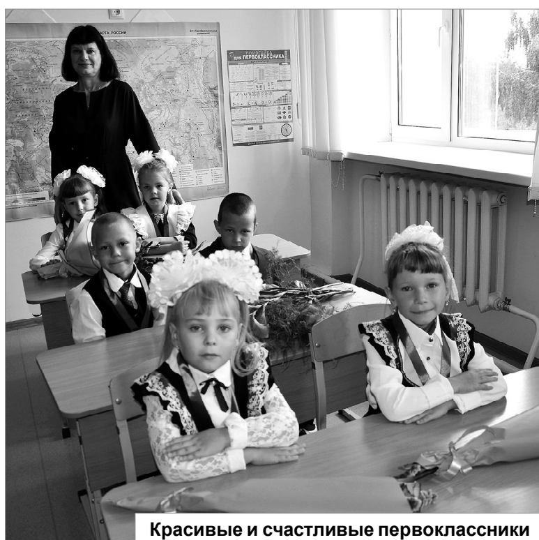
Красивые и счастливые первоклассники