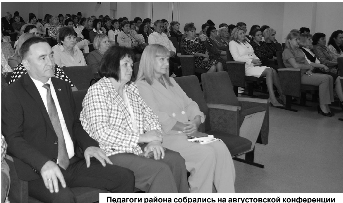
Педагоги района собрались на августовской конференции