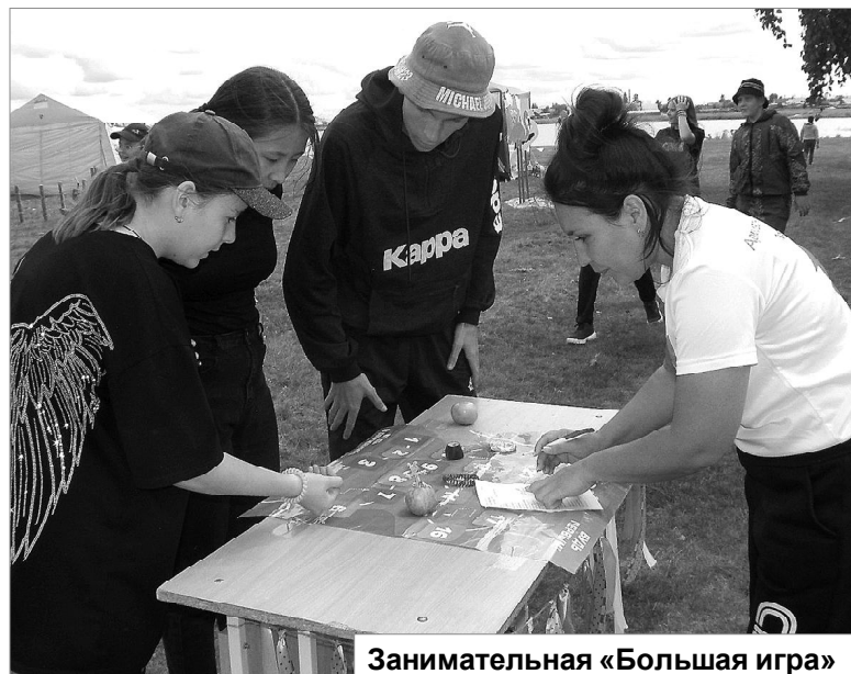
Занимательная «Большая игра»