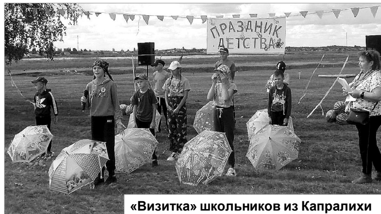
«Визитка» школьников из Капралихи

не стану, На свете ты один такой, Хвалить тебя я не устану...».