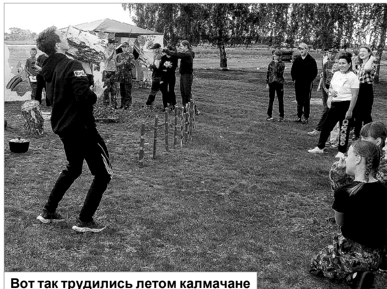
Вот так трудились летом калмачане