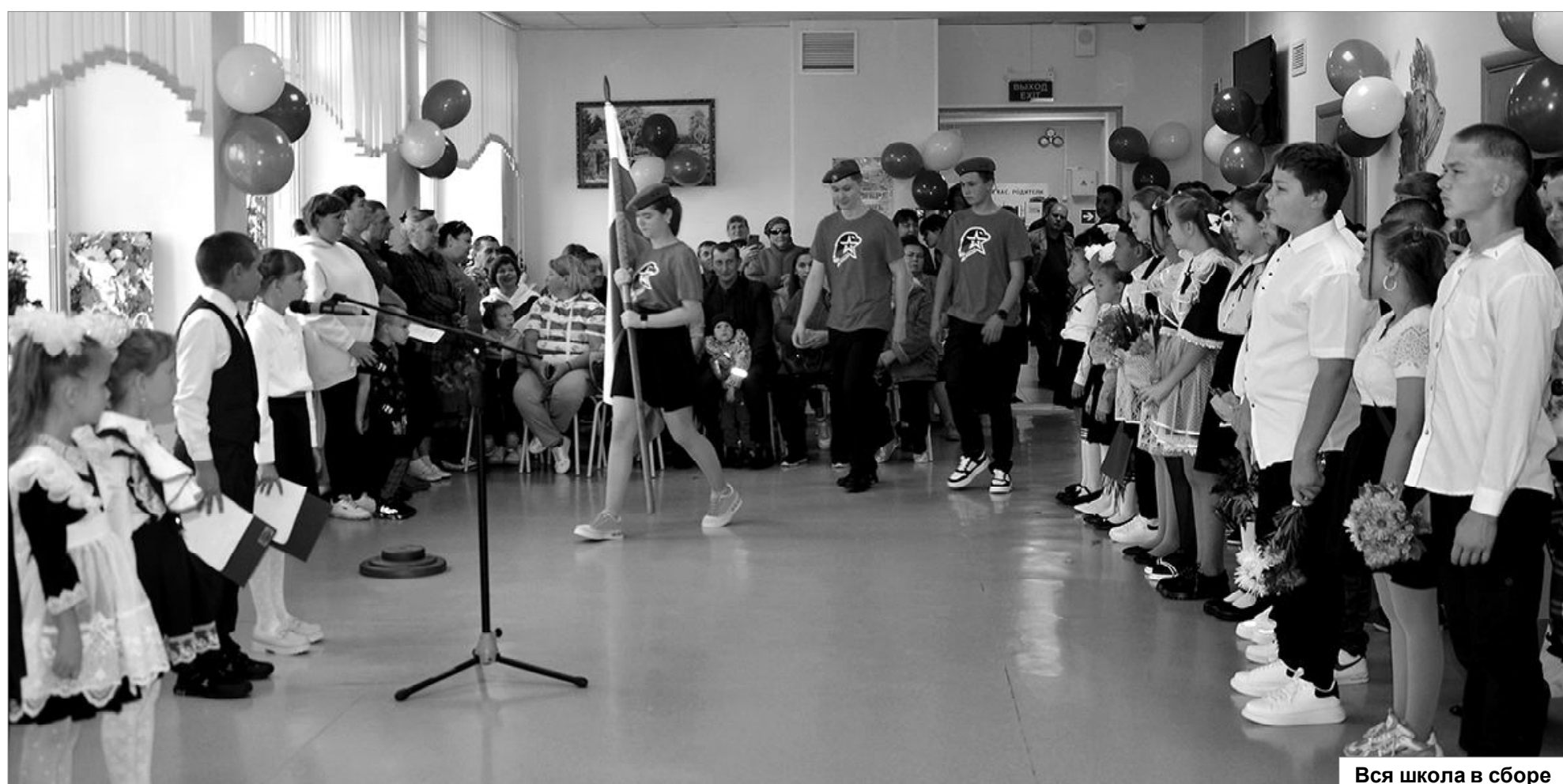
Вся школа в сборе