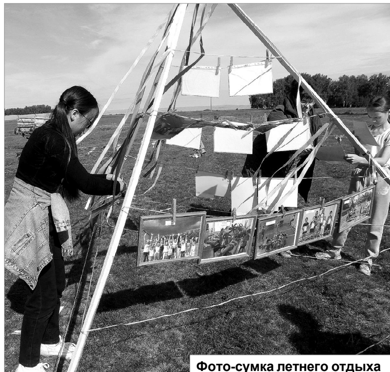
Фото-сушка летнего отдыха