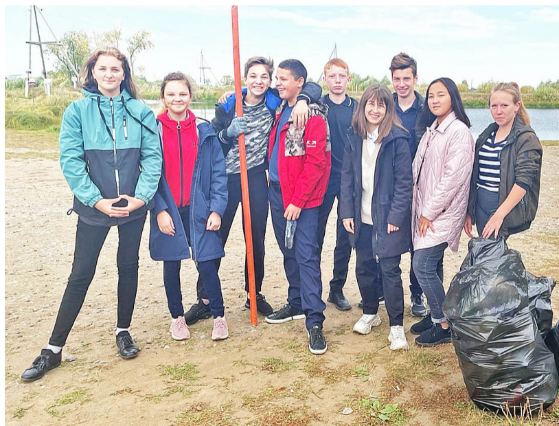
Ребята довольны, что сделали доброе дело

Призываю земляков бережно относиться к родной природе