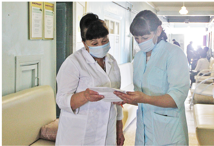
Врачи настоятельно рекомендуют жителям Казанского района, как можно серьёзнее относиться к своему здоровью

Как известно, лучшая защита от болезни — прививка. В районе продолжается вакцинация от коронавируса. На 27 сентября вакцинированы 8549 человек. Надо отметить, что вероятность заболеть после прививки пусть и небольшая, но всё же есть. Но медики уверяют, что в этом случае заболевание будет протекать в