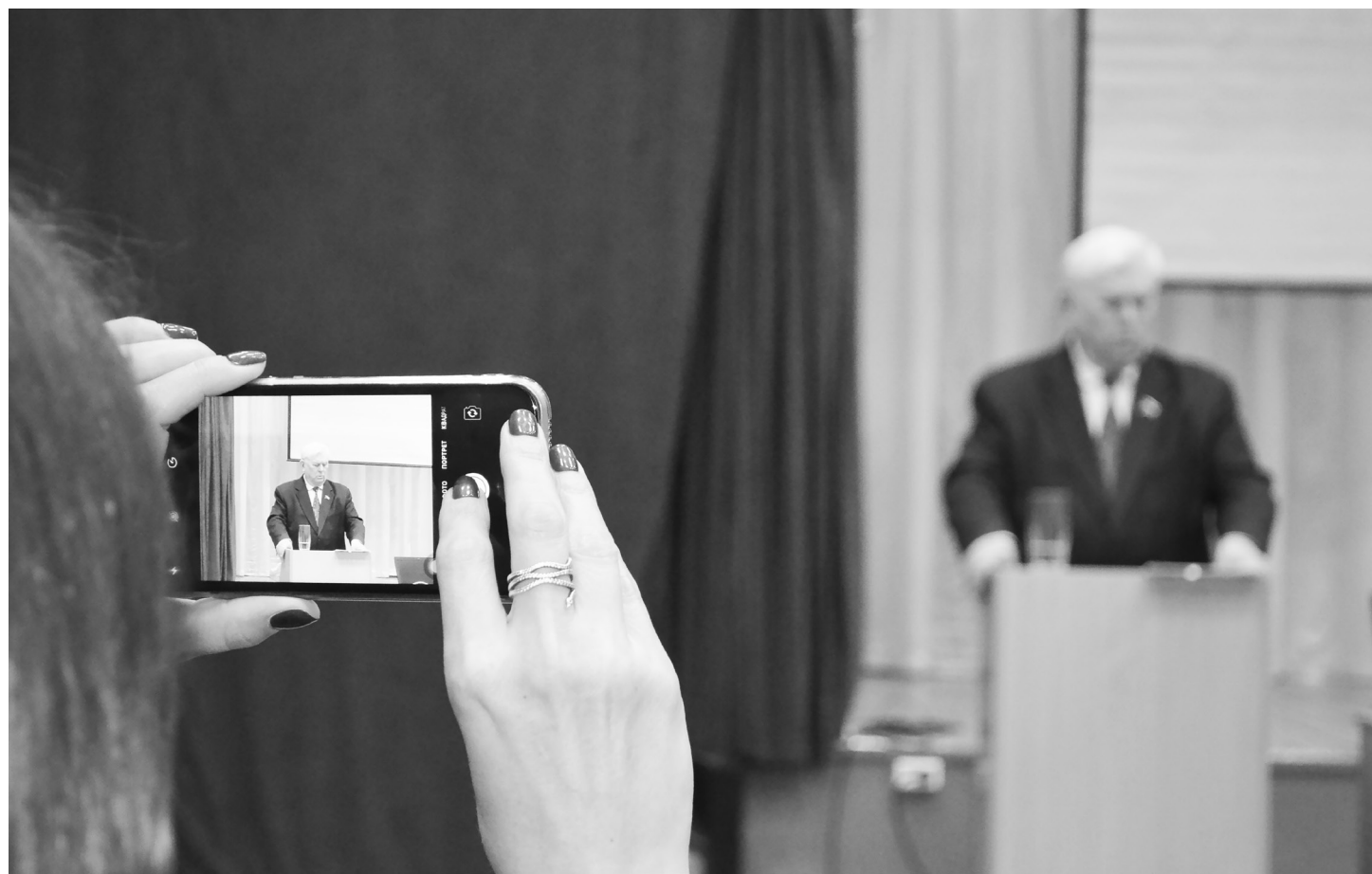
Депутат Тюменской областной Думы Юрий Конев привлёк всеобщее внимание своим выступлением. Законотворец высоко оценил бюджет региона и предложил поселению финансовую поддержку на благоустройство.