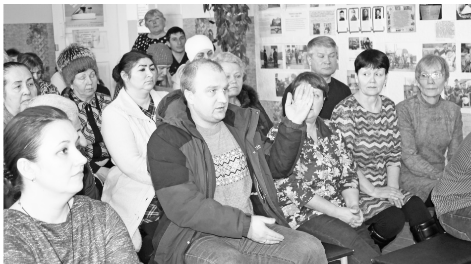
Когда же в Черепаново будет газ? Проблема тянется с 2000 года...