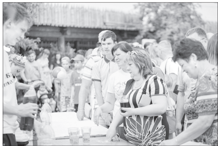
На фестивале гости выпили 1000 литров кваса и съели 100 литров окрошки

Телемост в рамках марафона «Территория первых» прошёл в четырёх городах юга региона - Ишиме, Тобольске, Заводоуковске и Ялуторовске