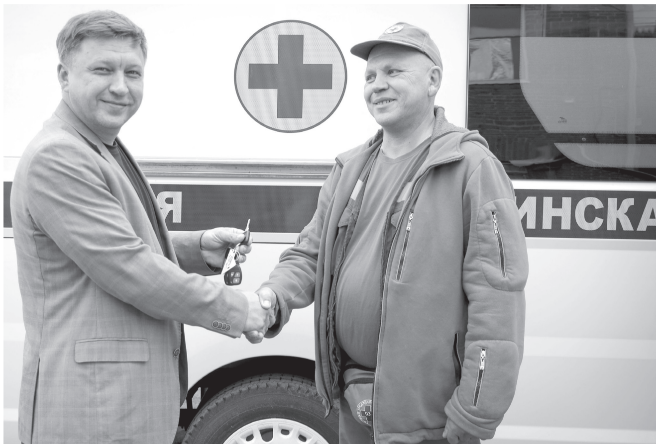
Вручение ключей от нового транспорта – всегда значимое событие в жизни областной больницы № 4.

На станции скорой медицинской помощи – период обновлений.