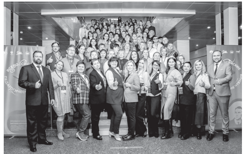
Участники педагогических чтений