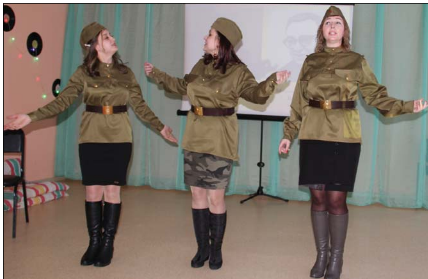
• Присутствующие на мероприятии активно поддерживали аплодисментами выступающих.