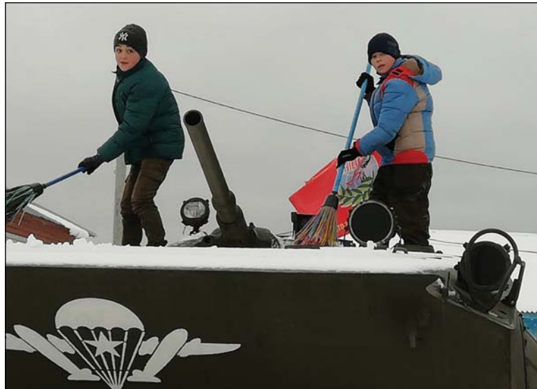
• Расчищая снег с БМП, ребята ощущают красоту и мощь российского оружия.

та по поддержанию памятников в надлежащем виде лежит на школьниках. Согласно графику, под руководством Сергея Балуква их очищают от снега и постороннего мусора школьники, обучающиеся в СФК «Беркут» и юнармейцы.