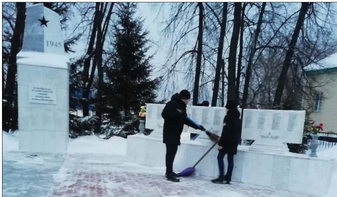
• Аромашевские школьники ухаживают за мемориальным комплексом в райцентре круглогодично.

нимую роль в патриотическом воспитании молодых людей. Благодаря этому ученики имеют возможность соприкоснуться с историей родного села и его жителей. Ведь в памятниках, расположенных на его территории, отражена не только история Великой Отечественной войны.