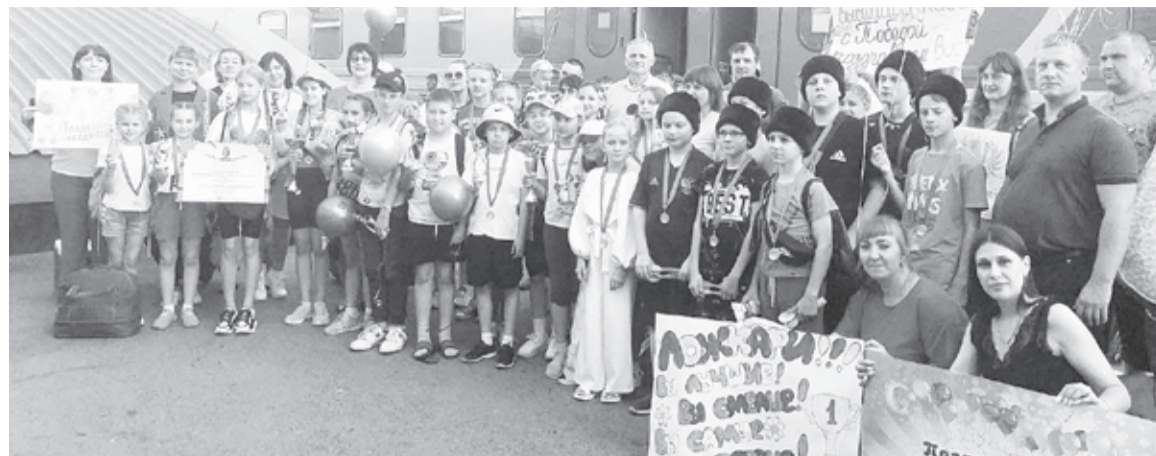
|| Юных артистов торжественно встретили на железнодорожном вокзале.

Старший состав «Исетских задоринок» показал «Случай на корабле» и «Тарантеллу», средний - «Ложки удалые» и «Крыжачок», за что и признаны лауреатами второй и третьей степени каждый. Также танцоры заняли второе место среди всех коллективов, принимавших участие в конкурсе, получили денежный сертификат и приглашение в Москву для участия в этом же конкурсе в следующем году. Ансамбль ложкарей «Сибирские забавы» за русскую народную