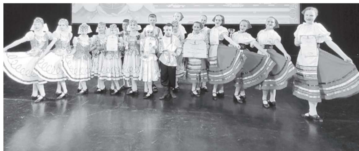
|| «Исетские задоринки».

- Действительно, это уникальный шанс показать себя. Выступление на конкурсе такого уровня очень значимо. Серьёзные, сильные соперники не дают расслабиться, заставляют работать, выкладываться в полную силу. Результаты, которых добились наши дети, очень хорошие. Они достойны всех этих оваций. Здорово, что у ребят была возможность не только побывать на конкурсе, но и узнать интересные факты о красивейшем городе во время экскурсии. Эта поездка им запомнится надолго, - добавляет мама воспитанника хореографического коллектива.