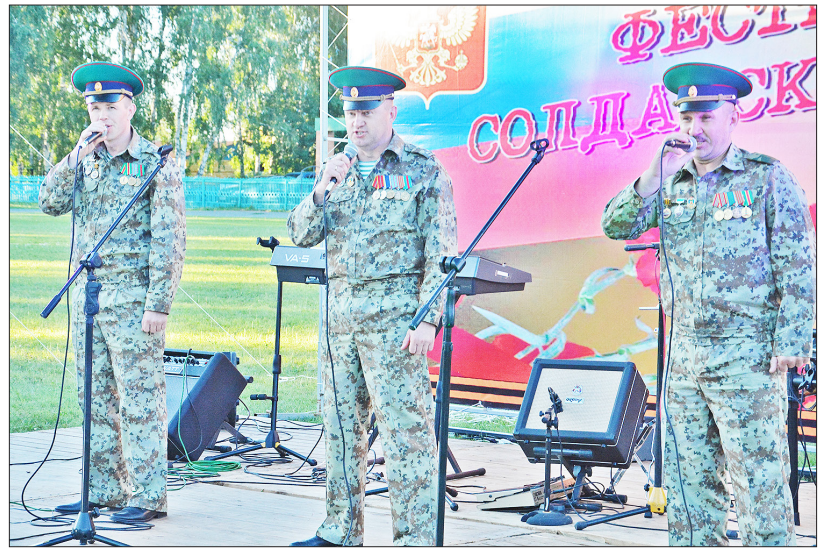
Группа «Рубеж 55» (г. Омск) впервые участвовала в фестивале

После дружеского турнира наступили часы отдыха. Кто-то общался с друзьями, кто-то фотографировал, а кто-то осматривал достопримечательности райцентра.