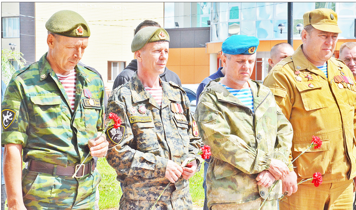
Ветераны и участники фестиваля почтили память погибших минутой молчания