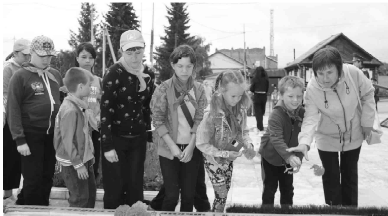
Память о тех грозных годах навсегда останется в наших сердцах

нам обо всех погибших, замученных в концлагерях, умерших от голода и лишений.