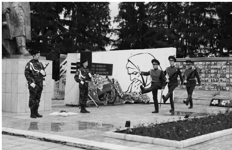
Почетный караул у памятника несут курсанты СГ ДПВС «Лидер»

Великая Отечественная война продолжалась 1 418 дней и ночей, в которой СССР потерял около 27 миллионов человек, но смог выстоять и, вопреки всему, победить. В тяжелой, кровопролитной войне советский народ внес решающий вклад в освобождение народов Европы от фашистского господства и в разгром гитлеровских войск. Этот день напоминает