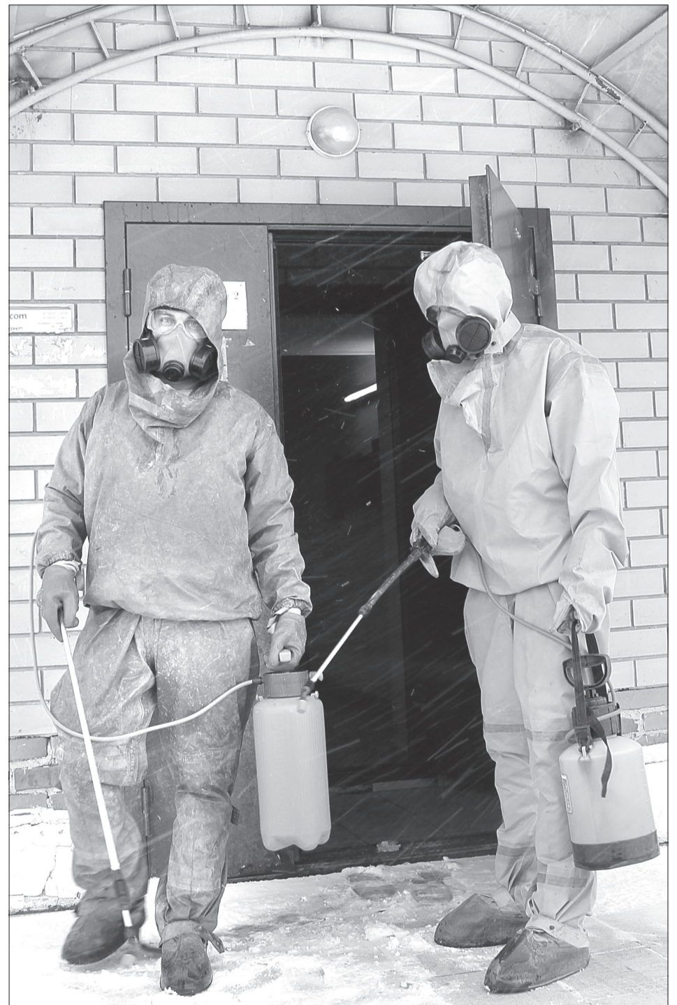
Для обработки сотрудники санитарных служб используют хлорсодержащие растворы, рекомендованные Роспотребнадзором