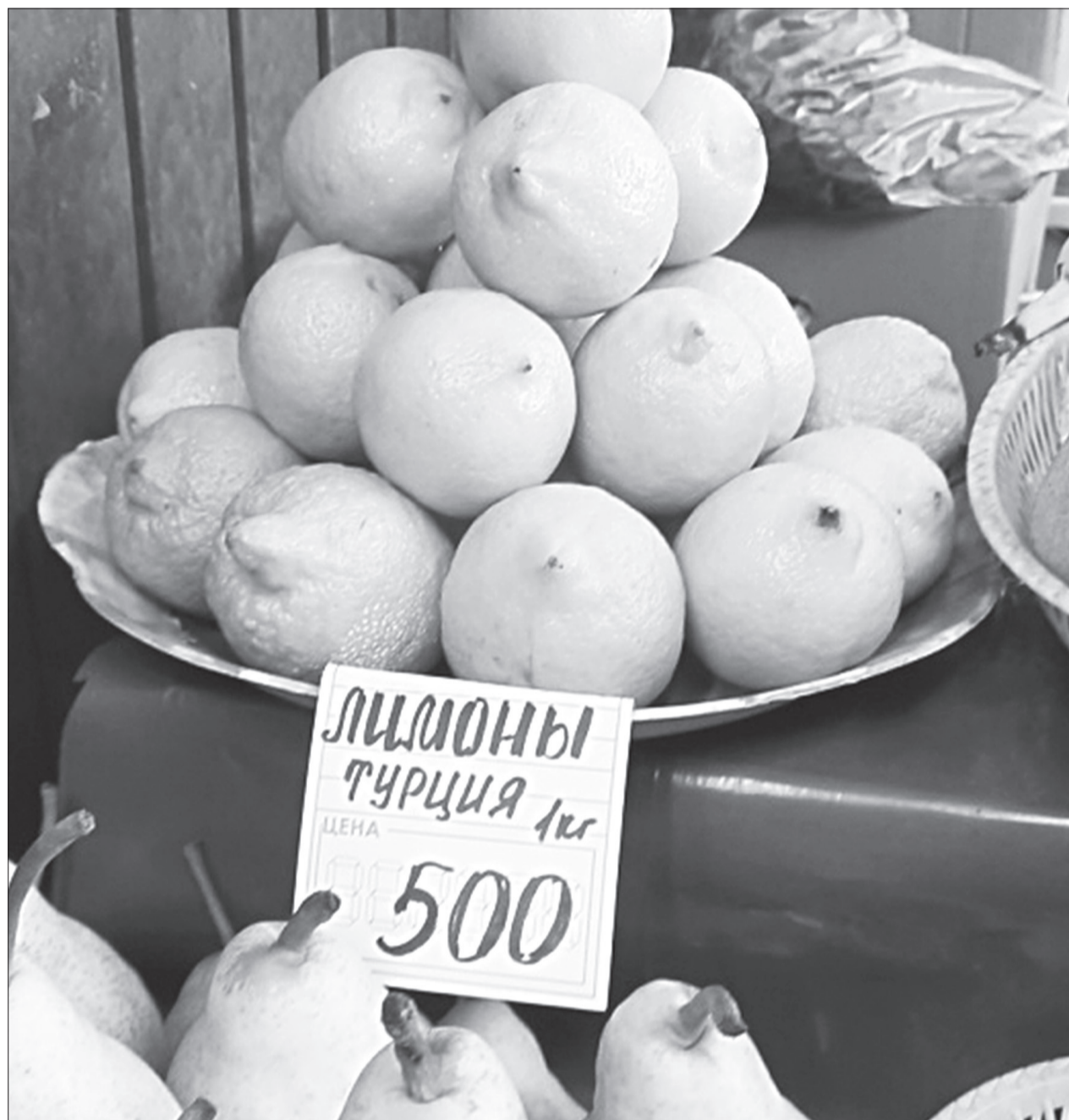
Такая картина наблюдается в основном в небольших магазинах, сети тоже подняли цены, но в пределах разумного