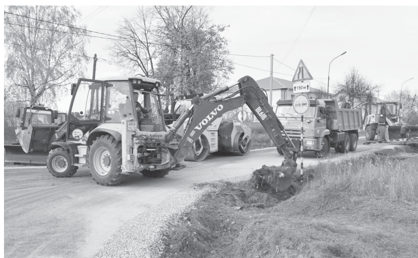
Ремонтные работы на улице Льва Толстого