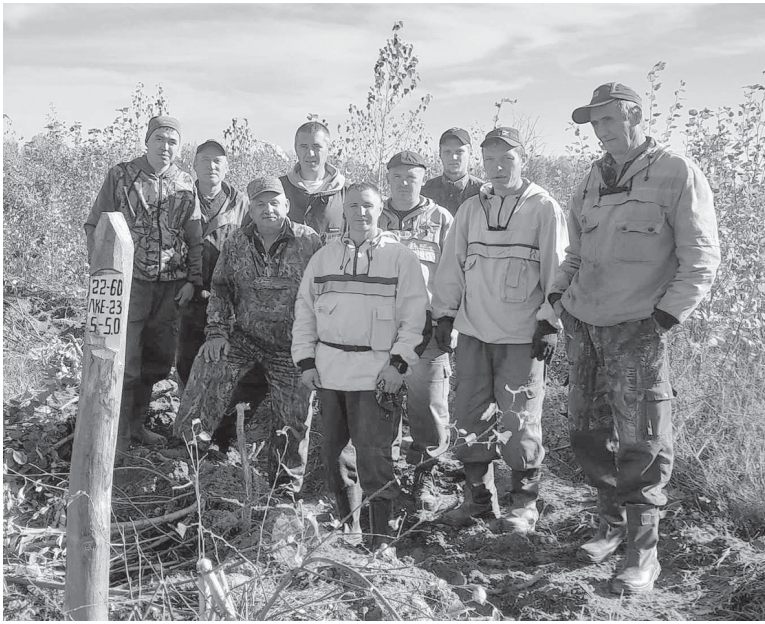
Благодаря этим людям леса в Яркковском районе не исчезнут

В Яркковском лесничестве есть традиция – делать каждый год на различных участках памятные посадки леса. В этом году такая акция состоялась на плехановской территории.