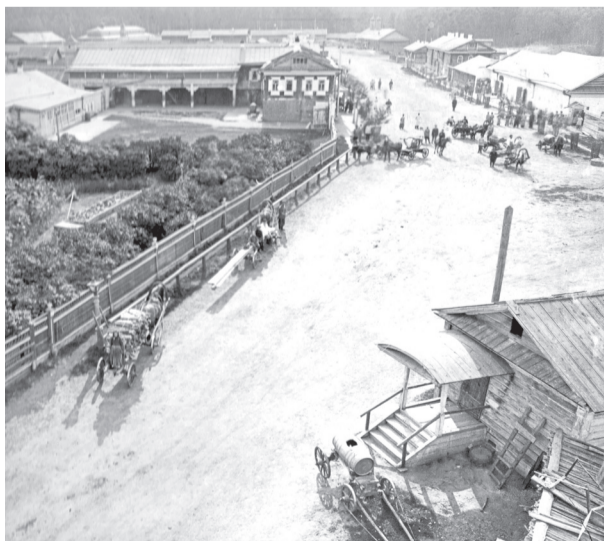
• Заимка купцов Колмаковых в Заводоуковске (вид на современные улицы Совхозную и Школьную).

Ольга МЯСНИКОВА Фото из архива краеведческого музея