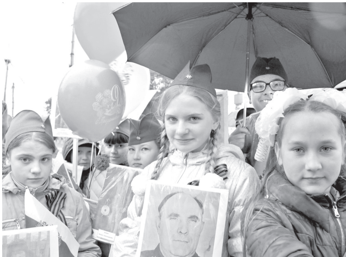
• Всероссийская акция «Бессмертный полк» обещает стать ежегодной.

Масштабная акция «Бессмертный полк» объединила миллионы человек не только в России. Патриотическое шествие в память об участниках Великой Отечественной войны поддержали и заводоуковцы.