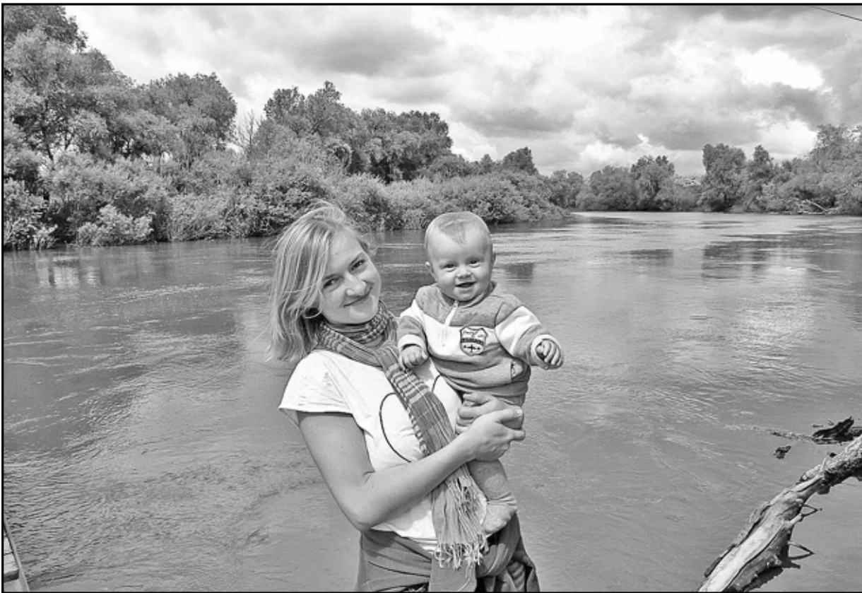
Солнце, воздух и вода – наши лучшие друзья