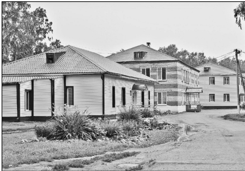
Современный облик корпусов больничного городка в селе Казанском