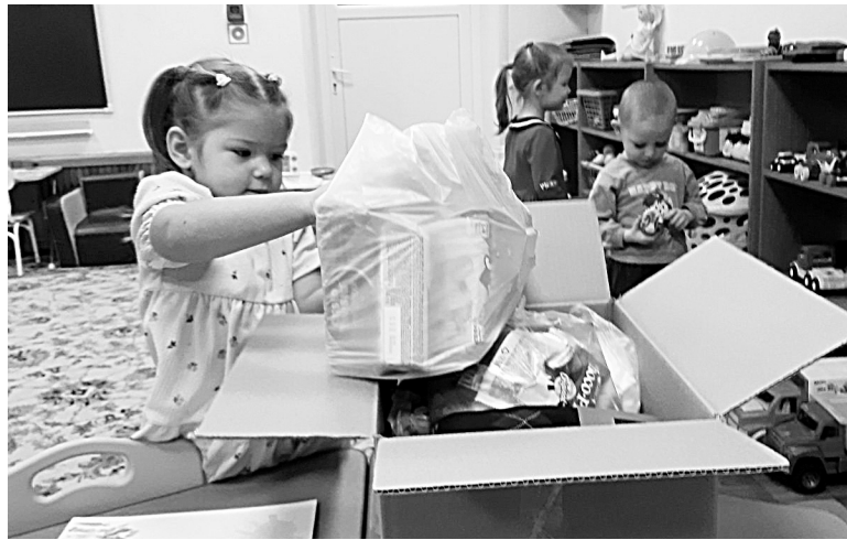
Малыши активно участвовали в акции: рисовали рисунки и собирали посылки

В преддверии Дня защитника Отечества по всей стране продолжается акция «ZoV сердца». Дети и родители первой и второй младших групп «Сказка» и «Гномики» структурного подразделения «Солнышко» не смогли