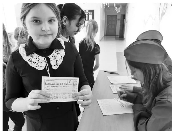
Каждый ребенок – участник акции получил символические 125 граммов хлеба

– Ребята и педагоги приняли активное участие в едином Всероссийском уроке «Без срока давности: Ленинград – непокоренный город», – говорит советник директора. – В Пегановской средней школе прошла акция «Письмо из настоящего в прошлое – детям блокадного Ленинграда». 79 лет прошло. Мы, современные люди, и представить себе не можем, каково это жить в городе, лишённом воды, электричества, тепла и хлеба. Терять близких, становиться взрослыми не потому что выросли, а потому что больше некому. Изо дня в день искать в себе силы, верить, что тяжёлые испытания когда-то закончатся. И только 27 января 1944 года Ленинград был полностью освобожден от фашистской блокады. Если можно было поддержать детей словом, отправить весточку туда, в блокадные дни, что было бы в этом письме? Какие слова? «Письма в блокадный Ленинград» были написаны нашими учениками. Пегановские ребята написали послания в прошлое, своим сверстникам блокадного Ленинграда, выражали восхищение их подвигом и благодарили ребят за мужество и стойкость, обещали хранить память о тех событиях. Когда все письма были написаны и оформлены, в фойе школы прошла выставка творческих работ учеников.