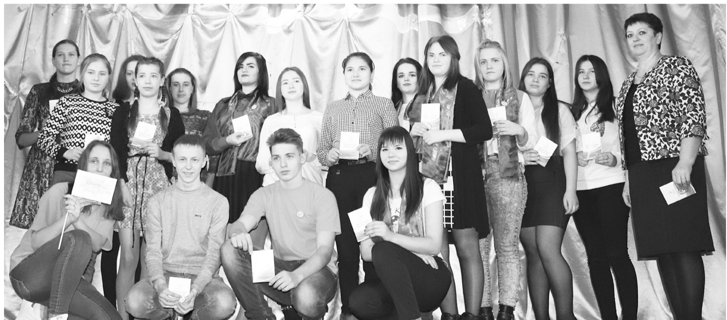
Вручение книжек волонтеров на торжественном мероприятии открытия Года добровольцев.