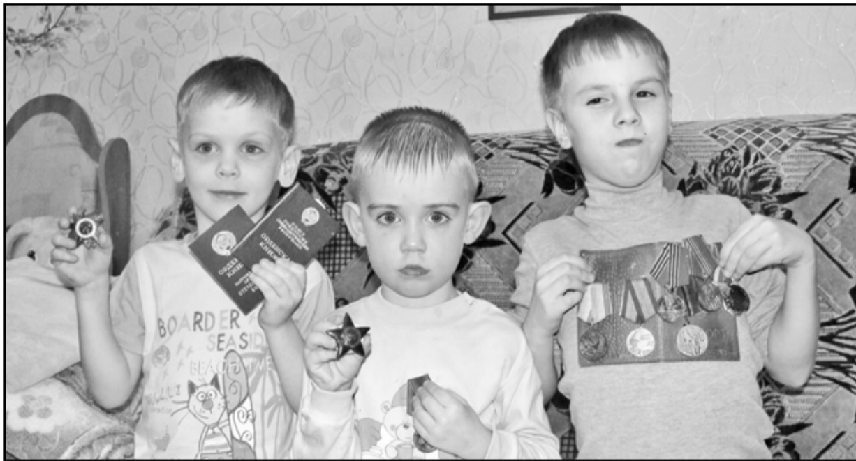
В наградах прадеда частичка Победы