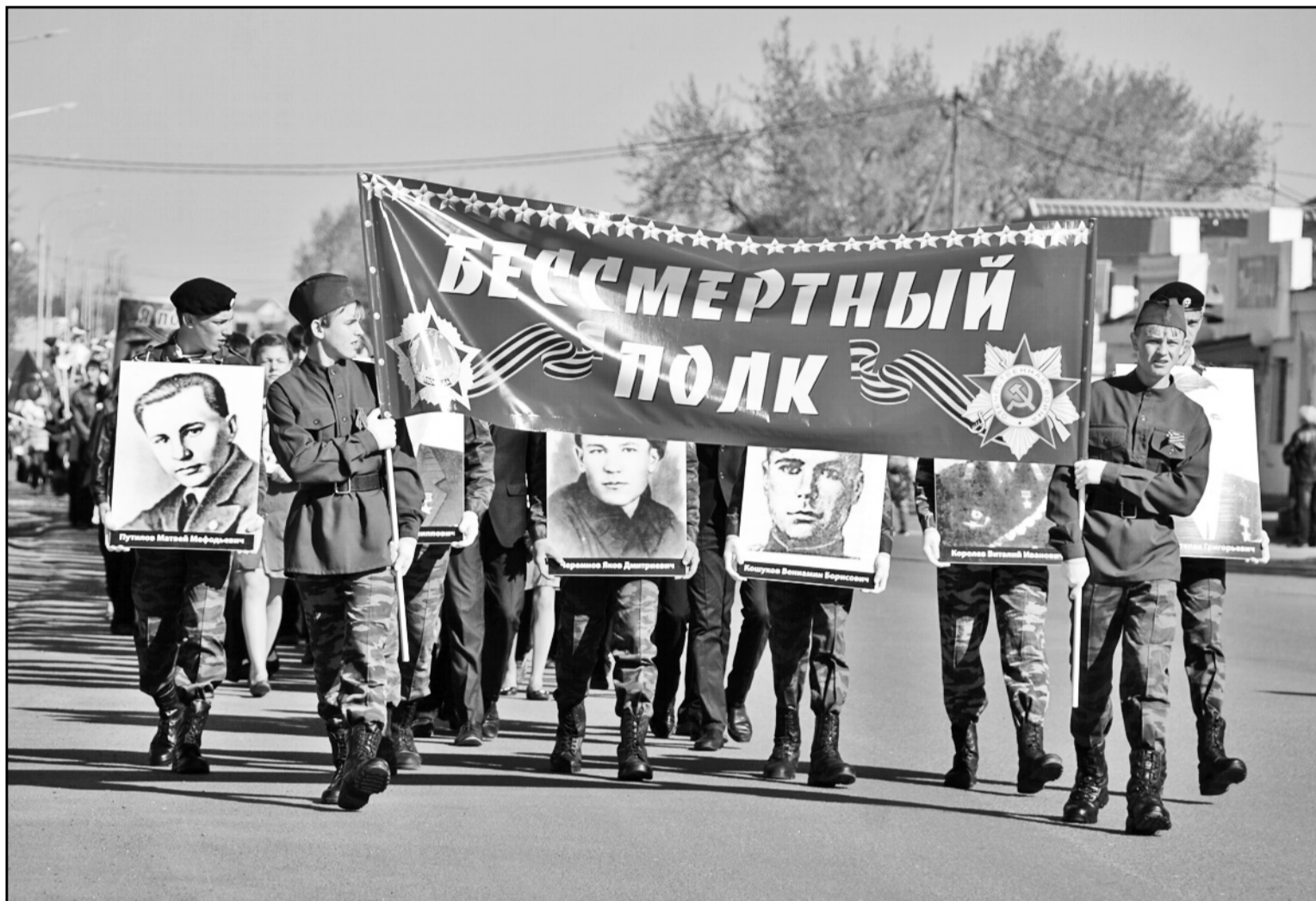
Нет в России семьи такой, где б не памятен был свой герой

Человек живёт, доколе его помнят. Смерть может лишит его жизни, но перед памятью она бессильна.