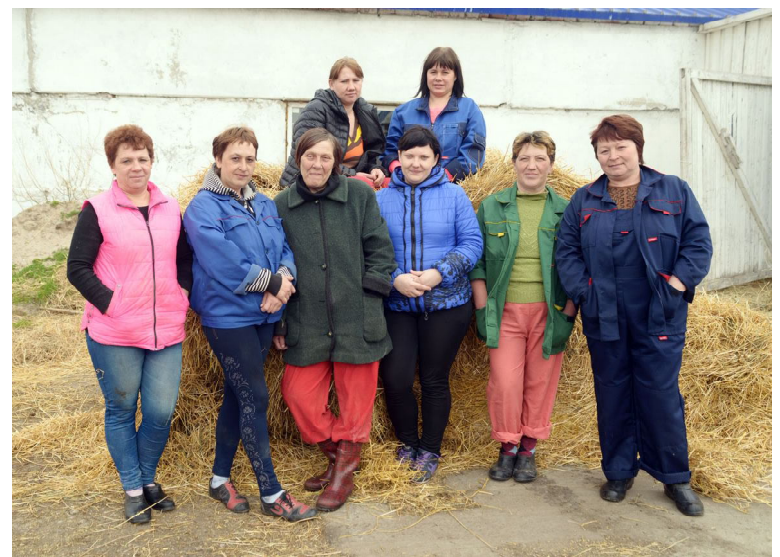
Дружный коллектив операторов машинного доения

С того момента, как на Шаньгинской ферме ООО Сп «Ситниковское» на месте выбракованных низкоудойных неблагополучных по лейкозу коров стали телиться вновь завезенные здоровые высокопродуктивные нетели, прошло несколько месяцев. Все эти животные были приобретены на птицефабрике «Боровская», а также в одном из племенных хозяйств Вологодской области. Чтобы дать сравнительную характеристику проведенных реорганизационных, оздоровительных мероприятий в хозяйстве, я выехал на ферму, где при общении с персоналом животноводов отметил много заслуживающих внимания моментов, над которыми стоит задуматься нашим производителям молока.