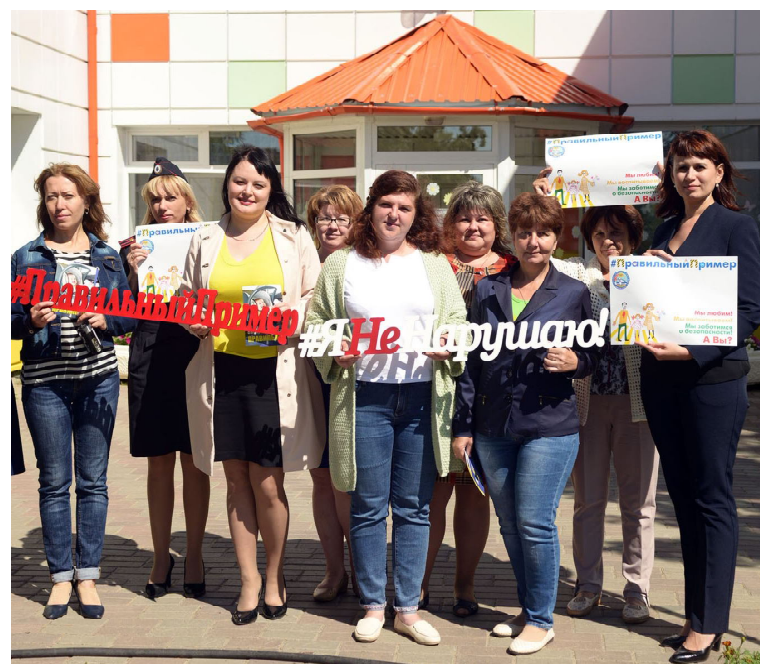
Мы показываем детям правильный пример!