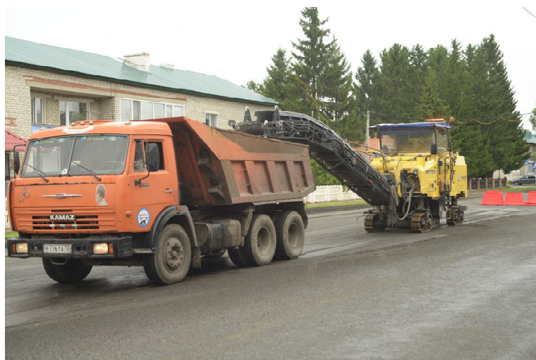
Идет фрезеровка асфальта