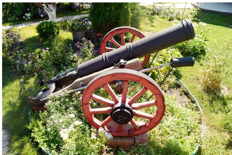
Пушка в саду сделана из подручных материалов