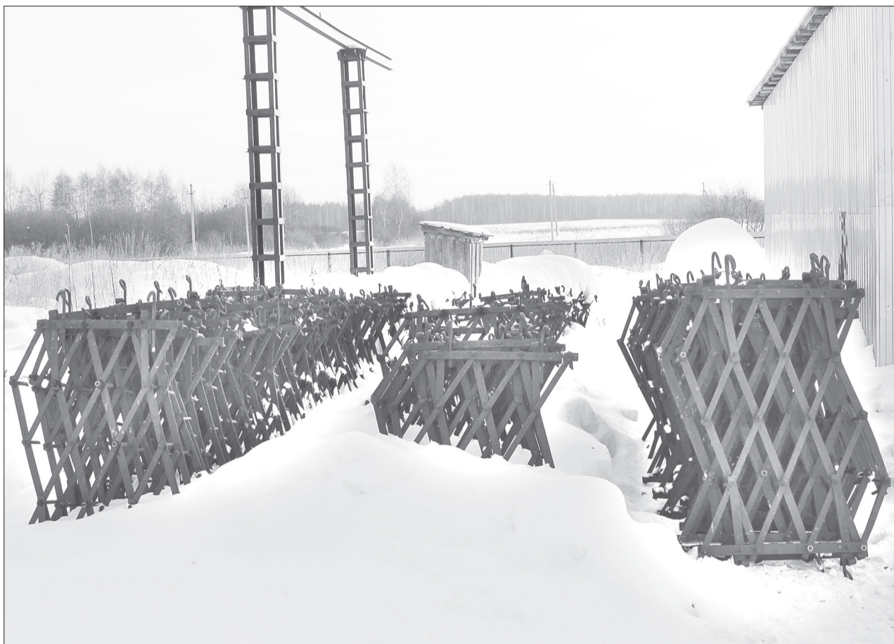
На линейке готовности - бороны, которые первыми вступят в весенне-полевые работы

Благочинный Ялуторовского благочиния протоиерей Александр ЛЕМЕШКО