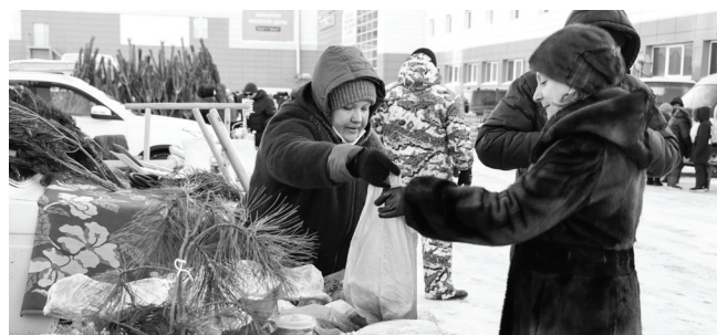
На зимней Никольской ярмарке царил праздничная новогодняя атмосфера. Без покупок не остался никто.

елками, продавцы охотно торговались. Те сосны, что останутся не проданными до Нового года, будут подарены церкви на Рождество.