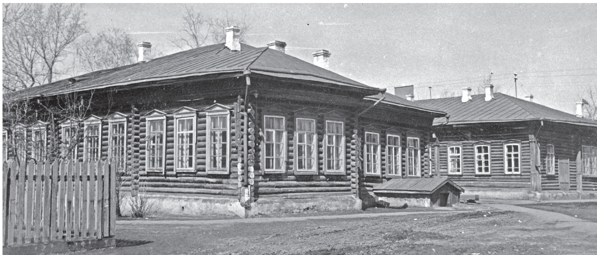
Такой вид обрела женская гимназия с пристроем 1911 года. Снимок 1950-х гг.