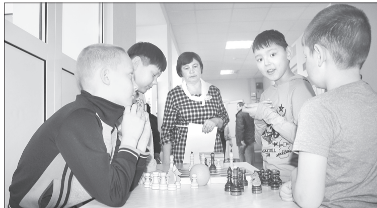
На клетчатых досках развернулись нешуточные баталии