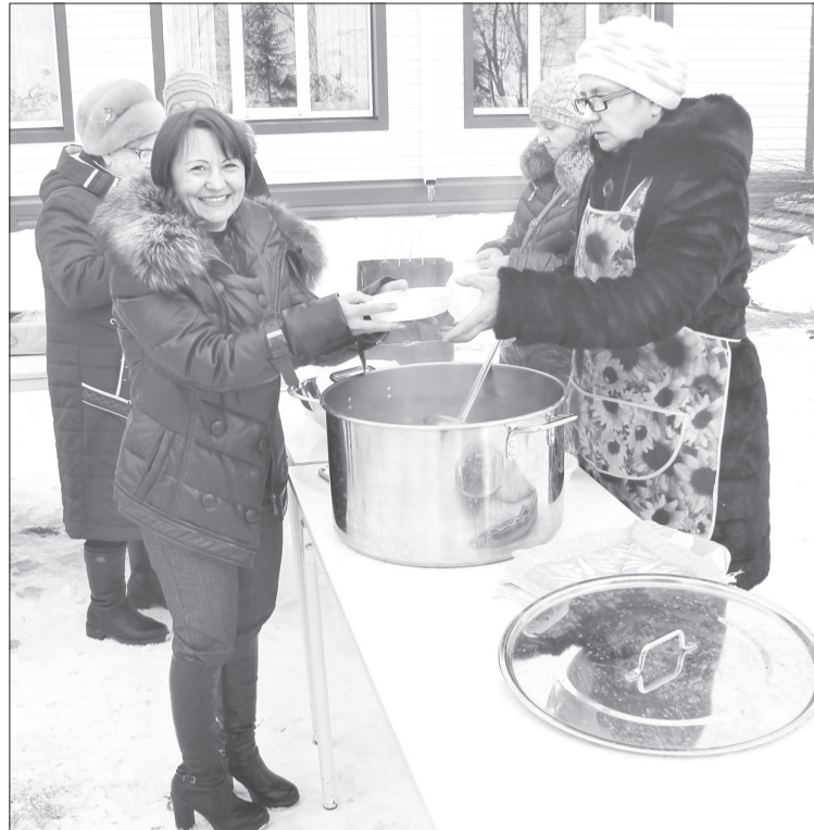
Горячие чай, выпечка и уха пришлось по вкусу бердюгинцам

Беркутане с большим интересом участвовали в историко-краеведческой викторине, посвященной 95-летию района. Многие показали недюжинные знания о природных и исторических особенностях родного края.