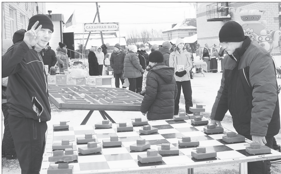
В гигантских настольных играх в Хохлово с одинаковым азартом «сражались» и дети, и взрослые