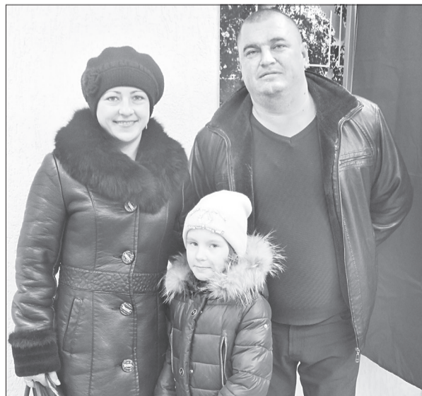
Григоруки из Хохлово: «Выбор сделан. Теперь можно и в викторине поучаствовать»