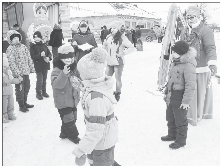
«Жмурки по-хохловски» - старая игра на новый лад