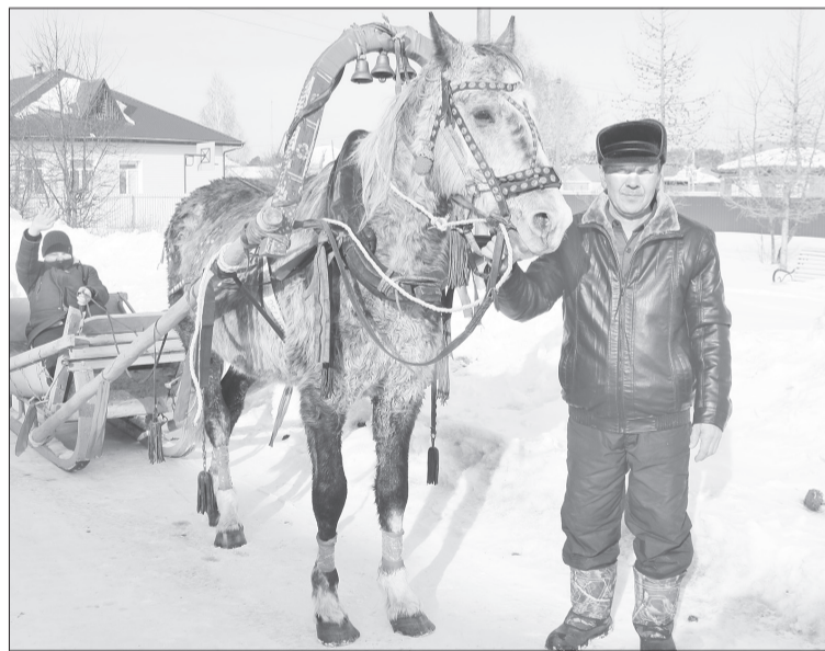
Конь по кличке Изумруд и его хозяин Алмаз - участники всех сельских и районных праздников

- На выборы вместе ходим традиционно, - говорит Надежда. - Только на этот раз с нами не пришла старшая Катя, но у неё уважительная причина - готовится к выступлению на концерте. Настроение - отличное!