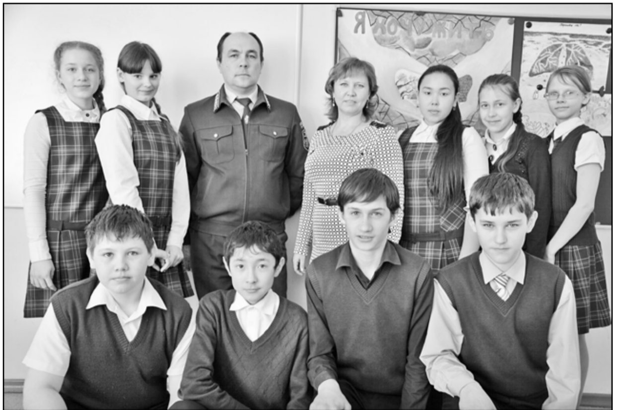
Члены кружка «Юные защитники леса» Ильинской школы

Курение в общественных местах является административным правонарушением, но, тем не менее, некоторые граждане этот закон нарушают. Курящего человека нередко можно встретить, к примеру, на автобусных остановках, автовокзалах и т.д. За такое нарушение, согласно части 1 статьи 6.24 Кодекса РФ об административных правонарушениях, предусмотрена административная ответственность в виде штрафа в размере от 500 до 1500 рублей. Если гражданин курит на детской площадке, ему придётся заплатить штраф в размере от 2 тысяч до 3 тысяч рублей.