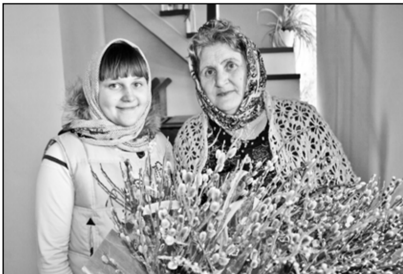
Как и две тысячи лет назад, женщины верно следуют за Христом