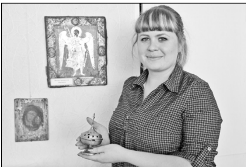
Сотрудники музея проведут экскурсию любому желающему

К счастью, для того, чтобы посетить выставку «Спаси и сохрани», толстого кошелька не потребуется – вход для всех свободный. Выставка будет открыта до 30 апреля.