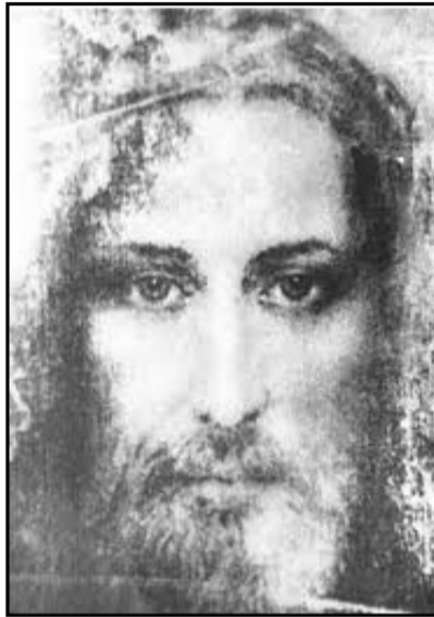
Реконструкция лица с Туринской плащаницы

Со страхом и радостью поспешили женщины возвестить апостолам об увиденном. А по дороге Христос встретил их и сказал: «Радуйтесь!» И они, подступив, ухватились