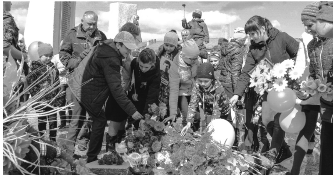
* Возложение цветов к обелиску.