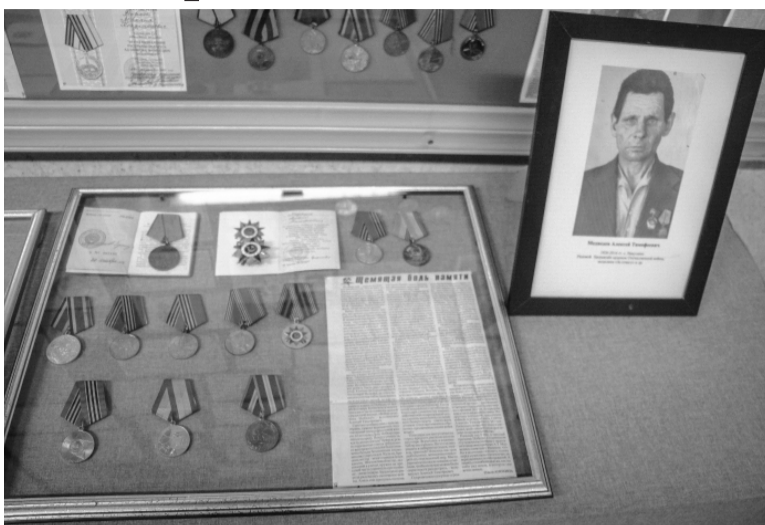
* Зал боевой славы пополнился выставкой.