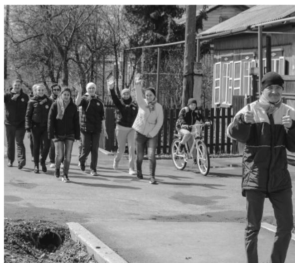
* Команды уверенно шли к победе.