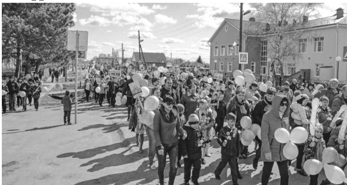
* Акция «Бессмертный полк» становится с каждым годом всё масштабнее.

В селе Сладково состоялись торжественные мероприятия, посвящённые Дню Великой Победы.