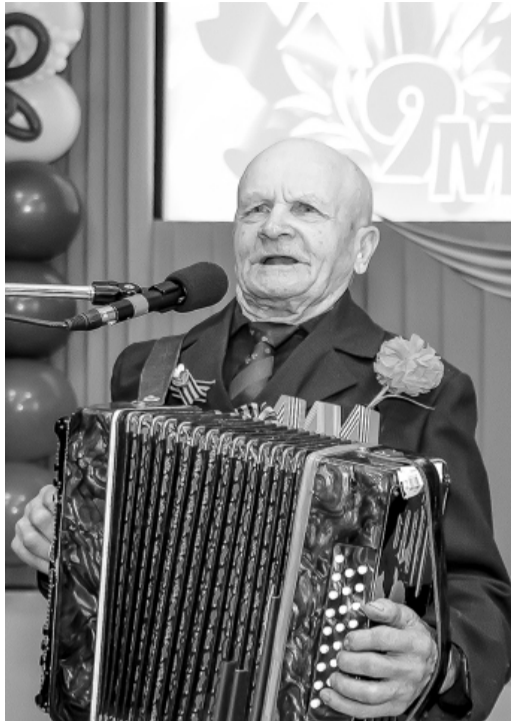
* На торжественном приёме главы царила тёплая атмосфера.