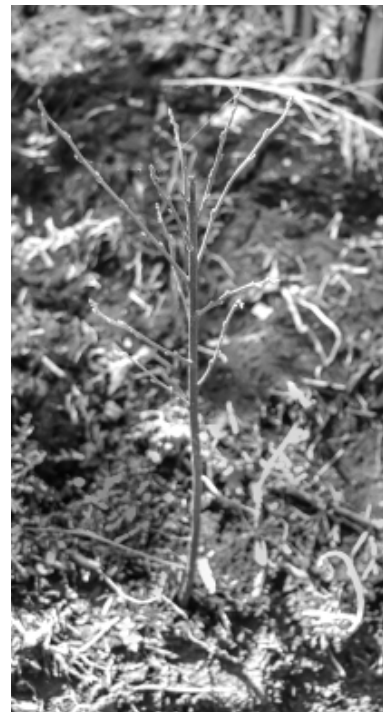
* Товар должен быть качественным, сортовым!

Управление Россельхознадзора по Тюменской области, ЯНАО и ХМАО