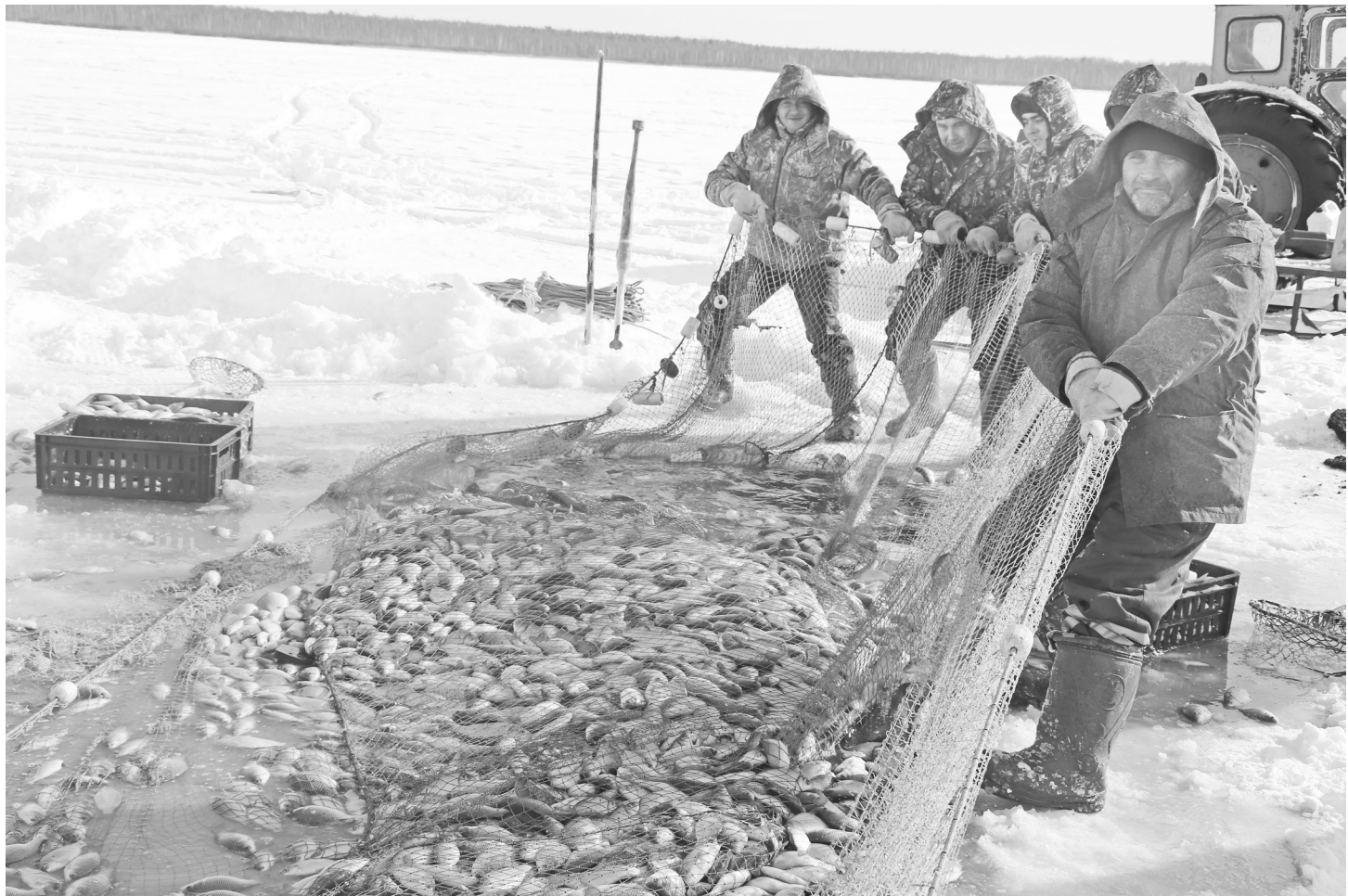
Радует глаз: финишная прямая ежедневного трудоёмкого процесса.