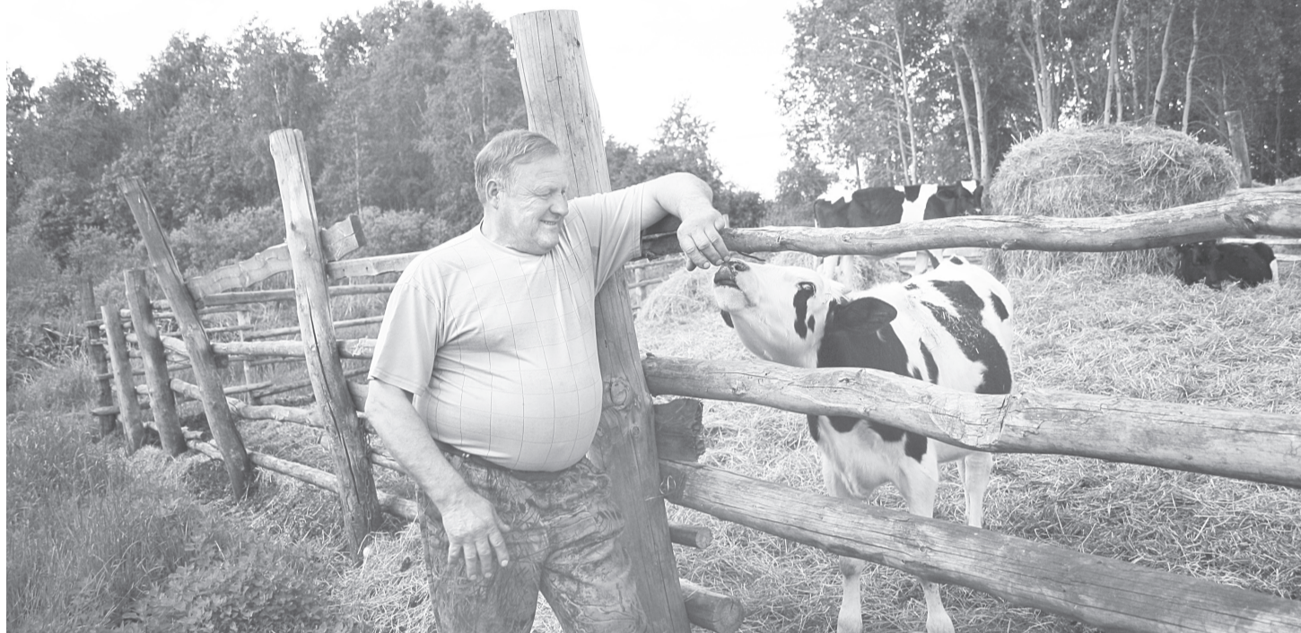
Сергей Георгиевич уверен: для животных важны не только корма, но и ласка