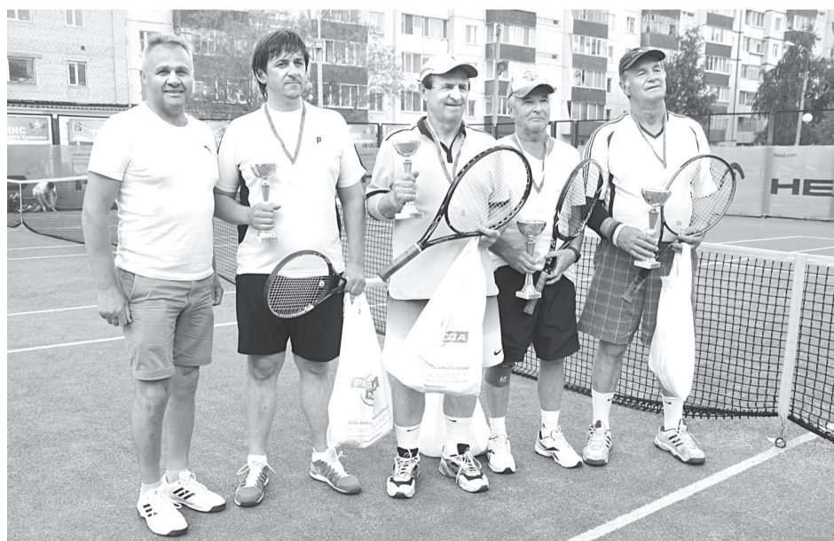
«Кубок Тобольского кремля» стал доброй традицией

Говорили о том, что «Кубок Тобольского кремля» давно уже стал доброй традицией и выразили уверенность в том, что турнир будет расти, развиваться, набирать обороты. Глава пожелал участни-