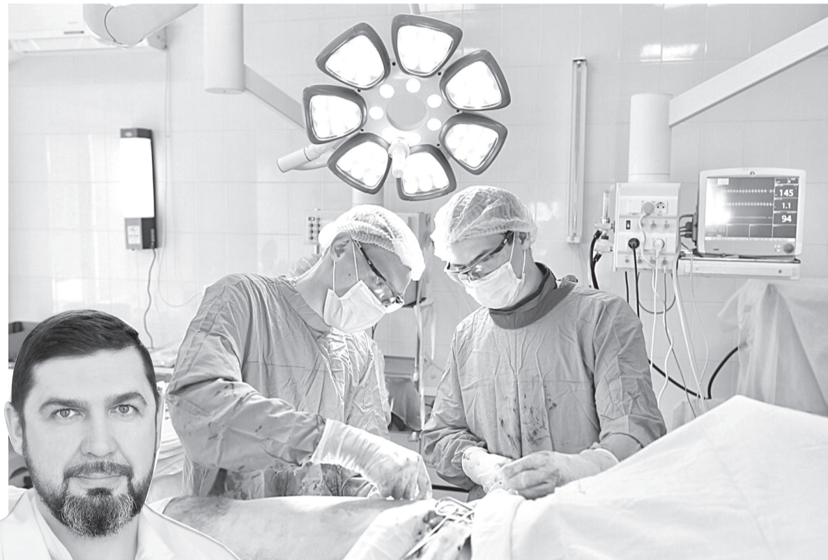
Хирурги травматологического отделения проводят операцию на бедре