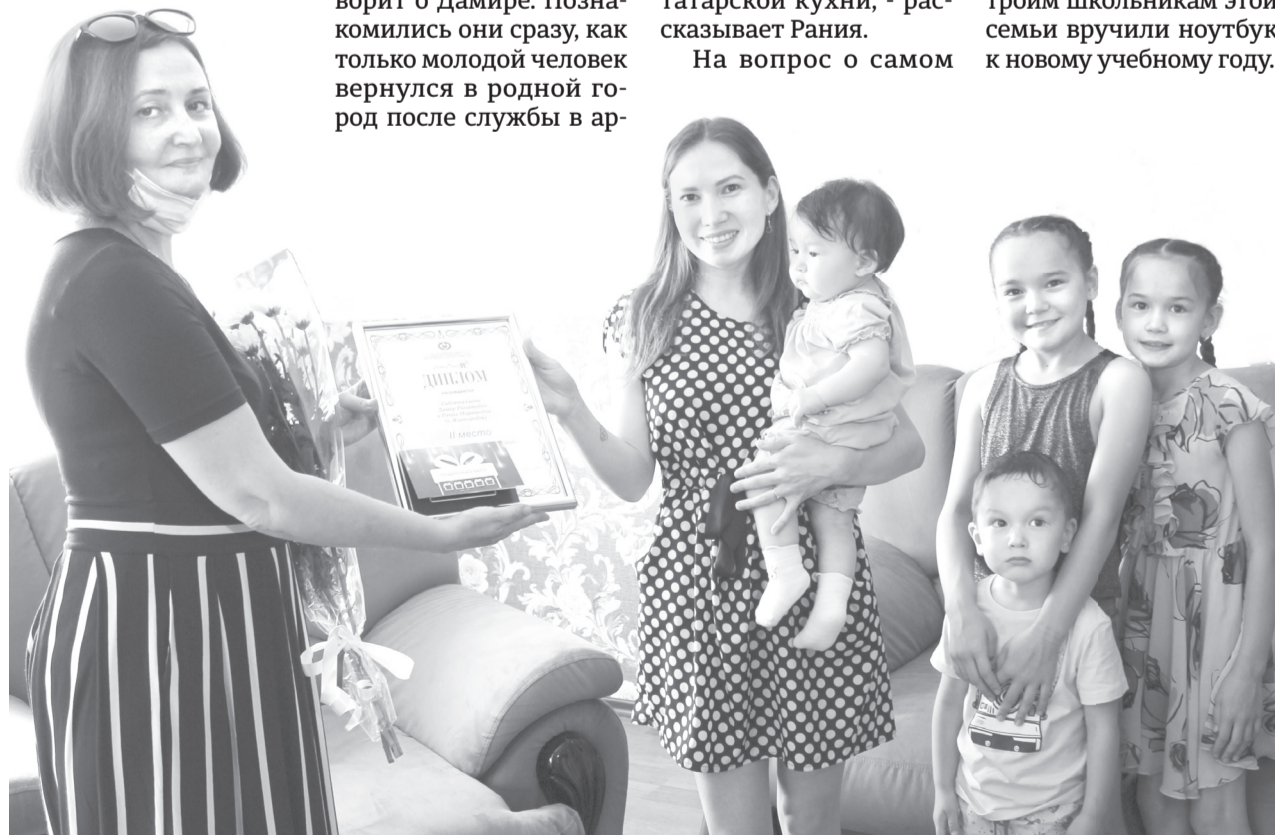
Главная ценность Сибгатуллиных - детки и любовь

Кстати, Сибгатуллины уже становились героями одной из наших публикаций. В середине июня троим школьникам этой семьи вручили ноутбук к новому учебному году.