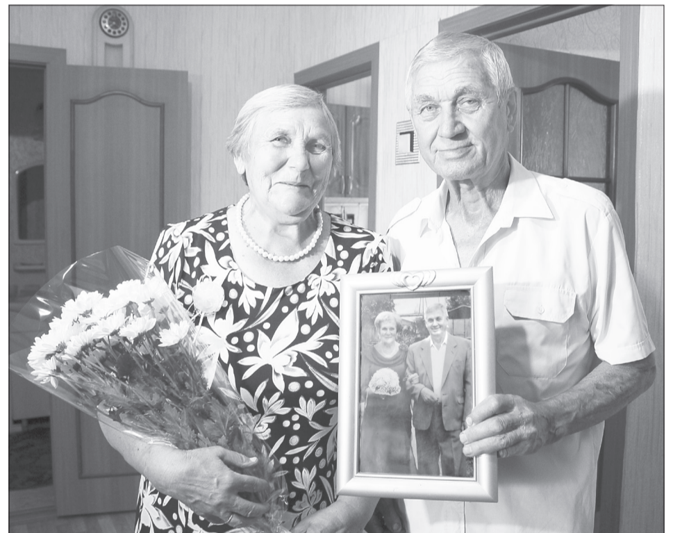
В доме Нижегородовых немало совместных фотографий. Одна из них - самая любимая