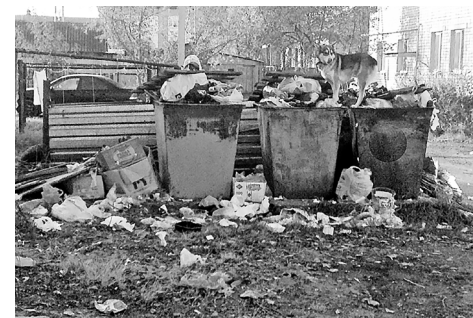
Чтобы подобные картины забылись как страшный сон.

В почтовых ящиках, на окнах в подъездах многоквартирных домов многие нижнетавдинцы обнаружили кипы бумаг, касающихся вывоза твёрдых коммунальных отходов, шла речь о региональном операторе и прочем. Ничего не понятно, и что с этой кипой делать, не ясно.