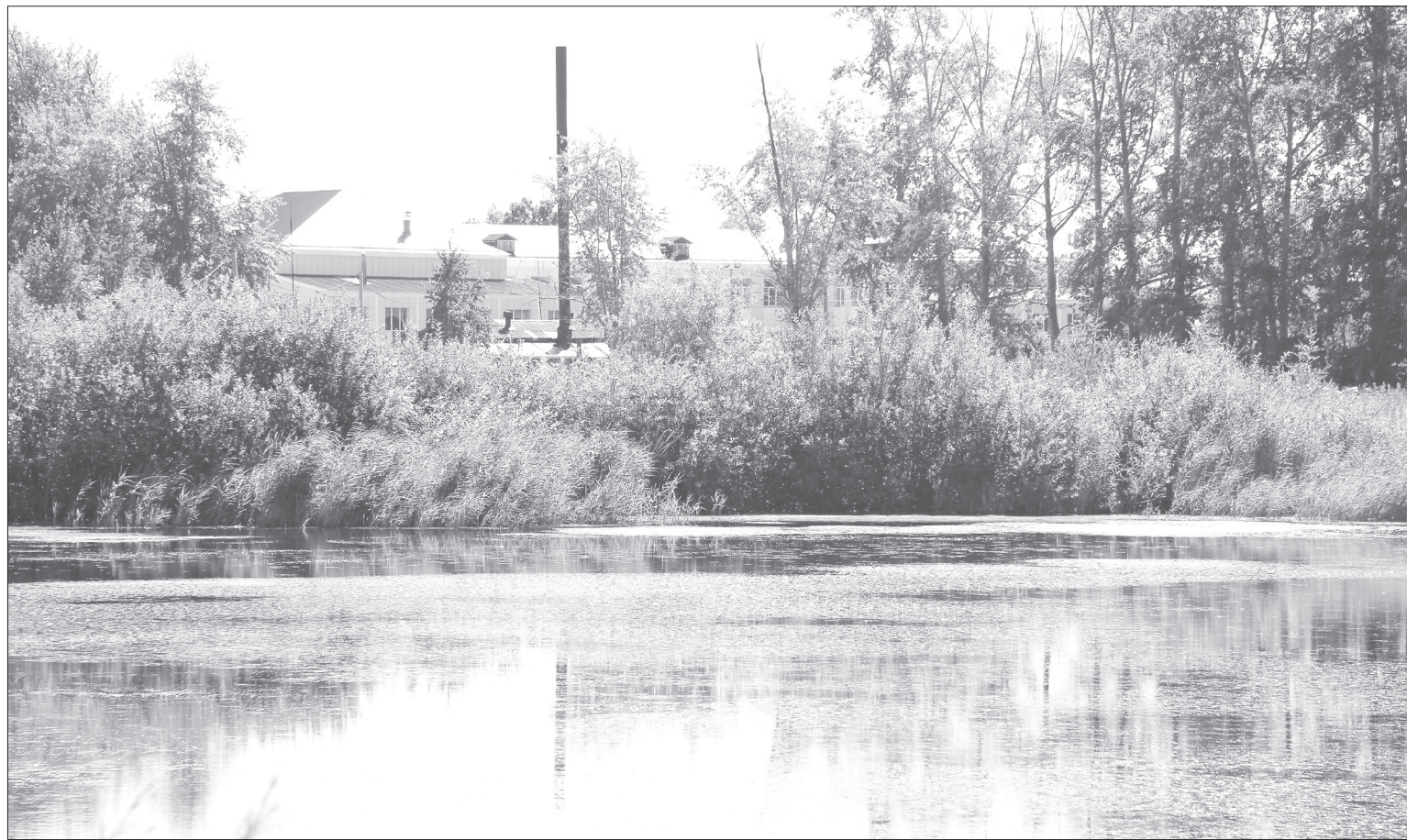
За котлованом, который зарос камышами, видна третья школа. На берегах пустынно, а раньше тут купались (неофициально)

А мы движемся к двухэтажке на Гроховского, из окон которой слышны эмоциональные возгласы. Рядом с домом притулилась редкая в наше время водоразборная колонка. Здание интересное, с двумя боковыми флигелями, но явно требует ремонта. Хотя