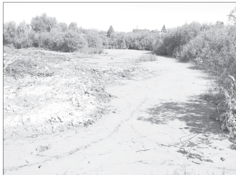
Здесь несколько каналов и котлованов. Иногда кажется, что находишься среди озёр и островов