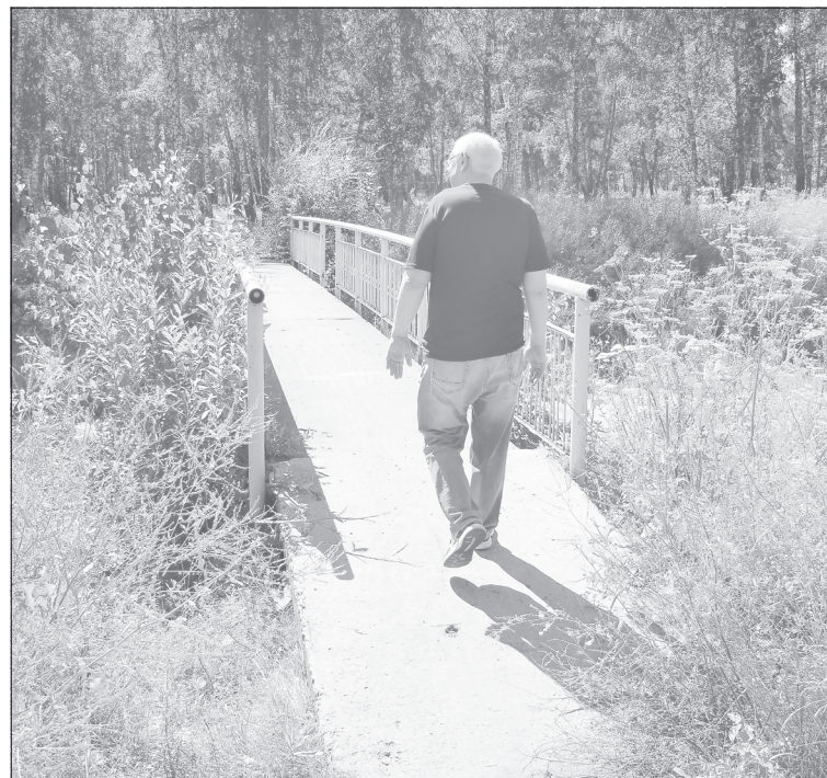
Похоже, что это единственный сохранившийся мостик через затянутый тиной канал, передвигаться по нему можно только пешком

ряской водоём с плитами спуска и перильной площадкой, затем другой, более чистый, но в камышах. Сразу за ним видно здание третьей школы. А где-то неподалёку, у рощи Декабристов, есть ещё один канал с мостиком. В общем, это целая водная страна. Но купаться здесь, конечно же, запрещено. Да и плавающий на поверхности мусор вряд ли кого-то вдохновит. Впрочем, возможно, что если изменится статус рощи, то природные ландшафты здесь станут благороднее.