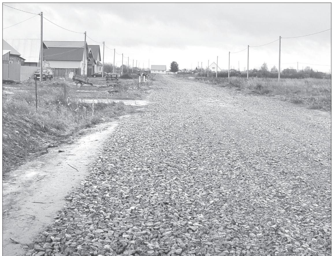
На улицах Полковникова, Жигайло, Филиппова, Артемьева закипели новые стройки, поэтому летом щебёнка появилась и в дополнительных кварталах /ФОТО АВТОРА

Газовая тема. Дом по ул. Чкалова, 10 на несколько дней