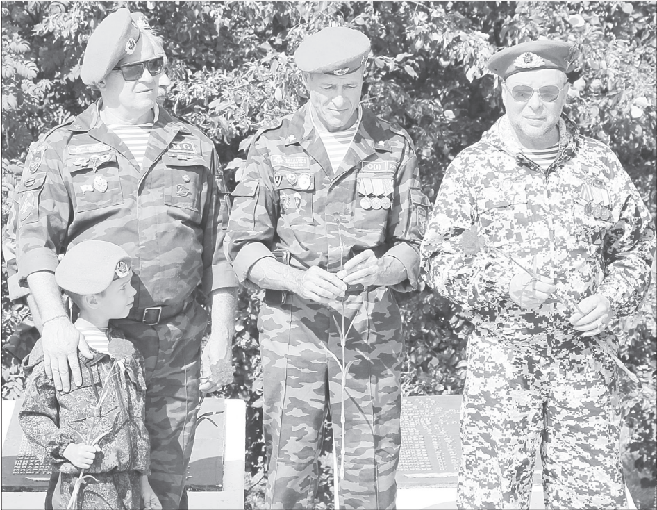
Традиционно на митинг десантники берут с собой детей и внуков