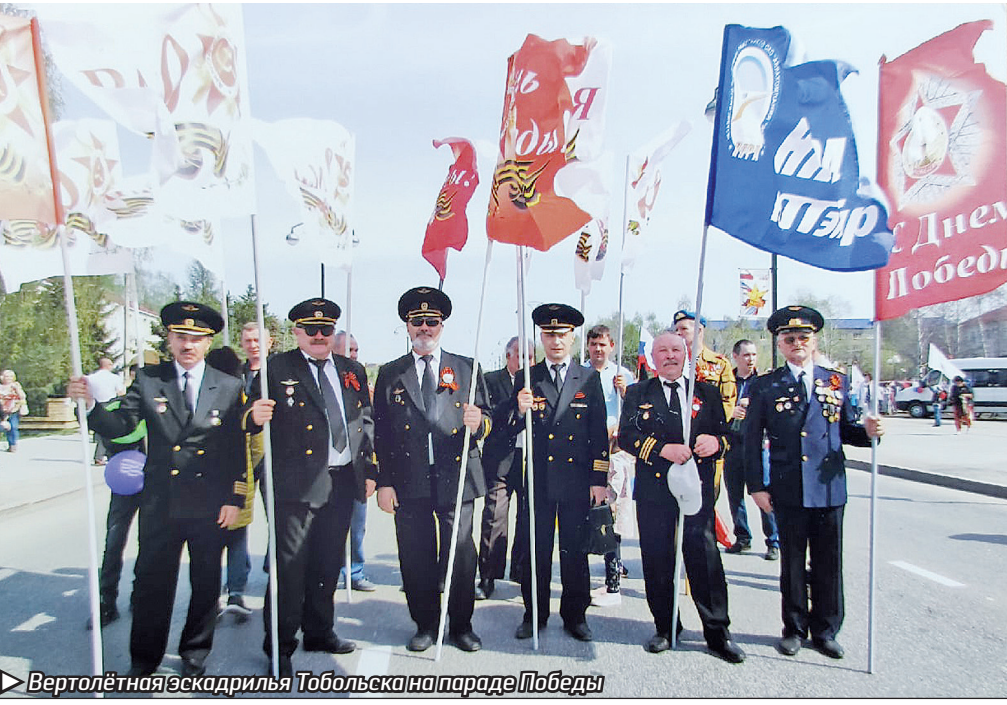
Вертолётная эскадрилья Тобольска на параде Победы

Увидели тоболяки воочию первый полёт аэроплана ещё в 1914 году на Панином бугре, даже гривенник заплатили за просмотр необычного зрелища. Потом только через 10 лет тобольские зеваки встречали самолёт «Юнкерс», который совершал марафон по маршруту «Свердловск – Тюмень – Тобольск – Ирбит – Свердловск». И вот в мае 1932 года на слиянии Иртыша и Тобола выполнил посадку гидросамолёт Ш-2 (ласково называли Шаврушкой). «Ясным солнечным днём на мысу собралась многочисленная публика, не только