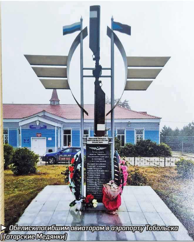
Обелиск погибшим авиаторам в аэропорту Тобольска (Татарские Медянки)

весь персонал только что открытого гидропорта, но и горожане, и жители деревни Татарские Медянки. Все ждали первого «клиента», – так описывала события наша газета.