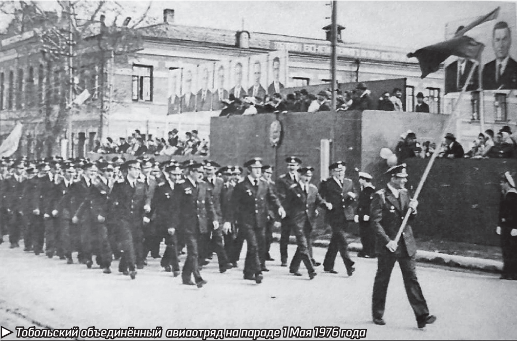
Тобольский объединённый авиаотряд на параде 1 Мая 1976 года