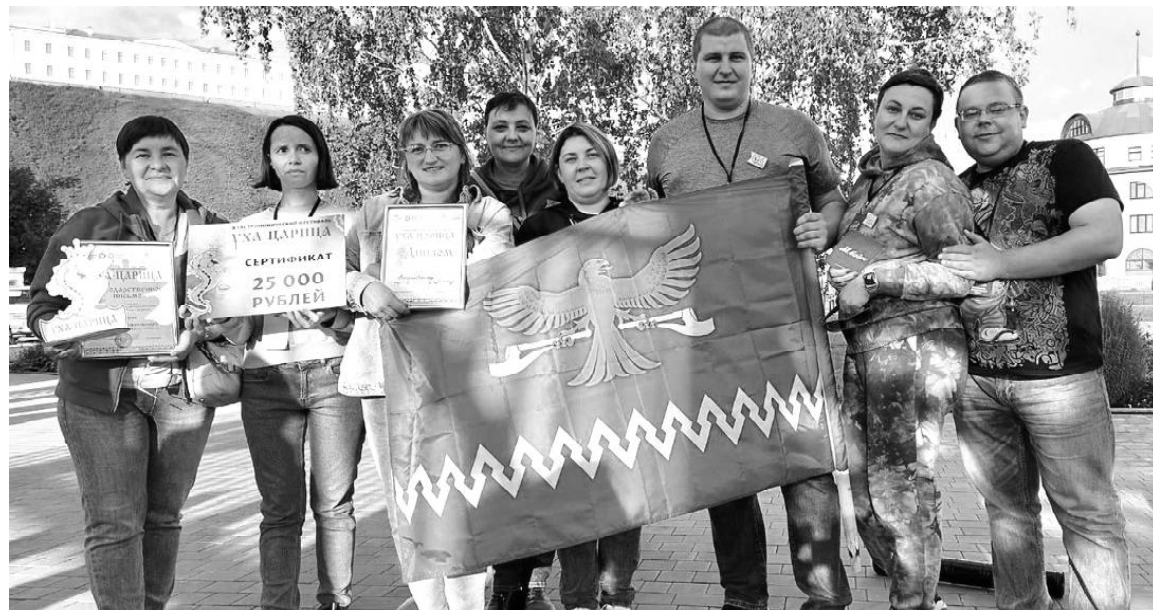
► Коллектив Викуловской школы № 1 на фестивале «Уха-Царица» в Тобольске

Тобольск называют культурной и духовной столицей Сибири. Но он манит туристов не только обилием памятников архитектуры и особой атмосферой старины. 2 сентября в этом городе на Иртыше прошёл гастрономический фестиваль «Уха-Царица». Город всегда славился рыбными богатствами, и вот уже в десятый раз здесь проходит грандиозное мероприятие. Теперь этот яркий семейный праздник – одно из любимых событий жителей и гостей Тобольска!