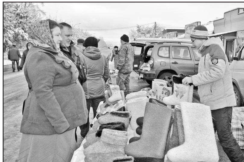
Валенки-самокатки предлагались на любой вкус и цвет