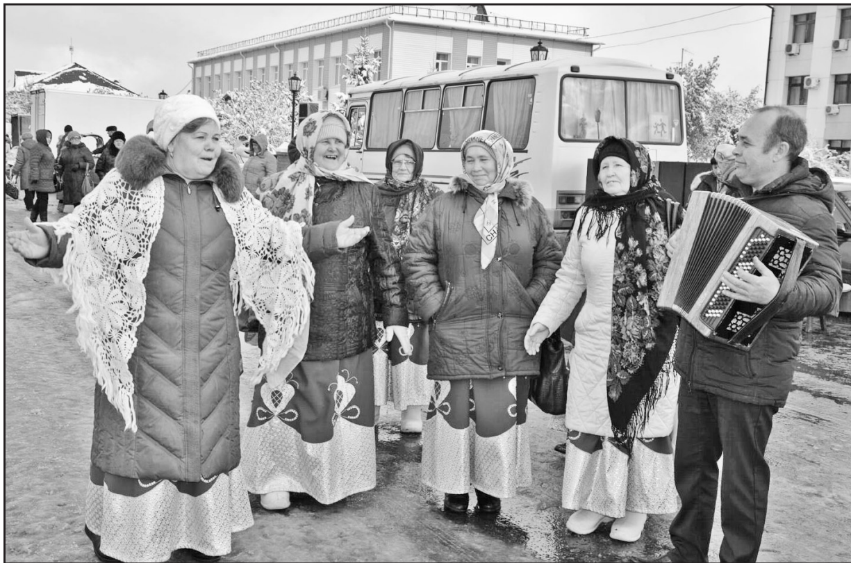
Задорные песни и частушки на ярмарке исполнял коллектив художественной самодеятельности «Рябинушка» из Больших Ярков