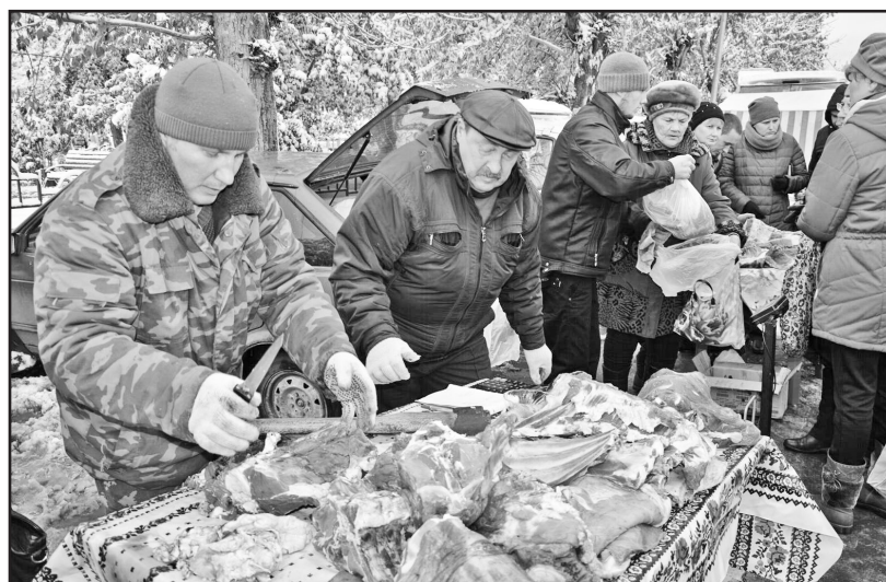
Мясо – продукт, востребованный на каждой ярмарке