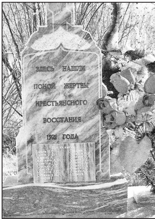
Памятник на братской могиле в Новопокровке