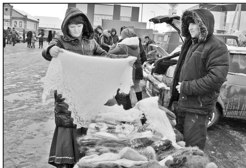
Пуховые платки, носки и варежки пользовались спросом у покупателей