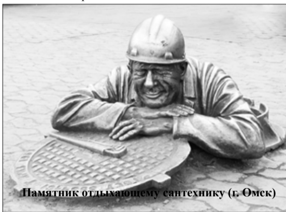
Памятник отдыхающему сантехнику (г. Омск)