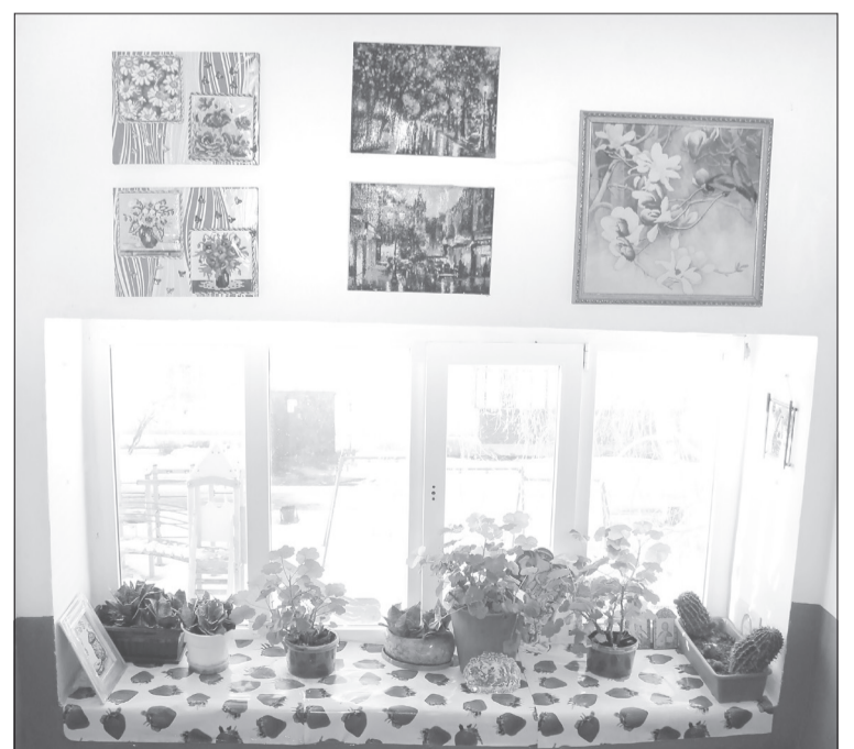
Подъезд украшают не только работы, требующие минимум времени, но и достаточно сложные в исполнении