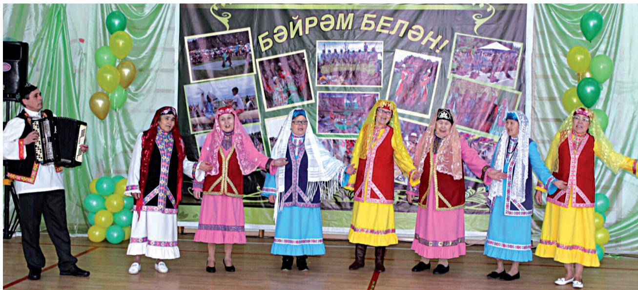
Культработники д. Ирек являются хранителями традиций своего народа

Важным показателем деятельности культуры Тобольского района, по мнению руководителя центра, является то, что сфера культуры активно развивается, повышается профессиональное мастерство работников отрасли, проводятся фестивали и конкурсы, выставки, творческие встречи и многое другое. Отрадно, что труд их получает достойную оценку. Согласно приказу департамента культуры Тюменской области № 64 от 10 марта 2020 года, присвоены звания «Образцовый коллектив любительского художественного творчества» инструментальному ансамблю «Весёлые ложки» Бизинского СДК и хореографическому ансамблю «Каприз» Прииртышского СДК.