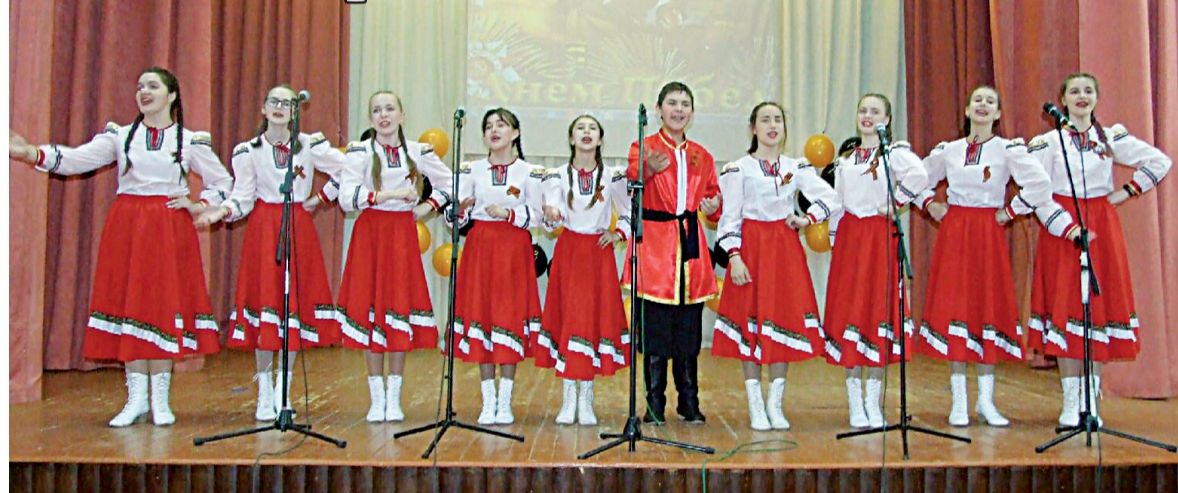
В числе победителей – фольклорный ансамбль «Веретёнце» из Прииртышского ДК