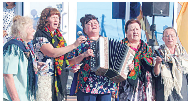
По итогам года лучшим сельским клубом стал Овсянниковский СК

дают будущим поколениям ценности традиционной культуры, но и формируют у людей чувство национального достоинства, взаимопонимания и согласия. От их творческого труда, влияния на общество зависит и улучшение качества человеческих взаимоотношений. Ведь именно культура и искусство напоминают людям о вечных ценностях, учат их быть добрее к ближнему, подарить радость общения с миром красоты и друг с другом. А потому мне хочется пожелать моим