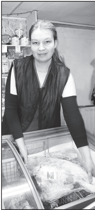
Мясные полуфабрикаты – с собственного подворья