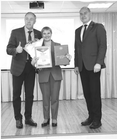
Награды за достижения и праздничный концерт подняли настроение всем гостям торжества в честь местной организации ВОИ

35 лет назад создали Голышмановскую общественную организацию инвалидов