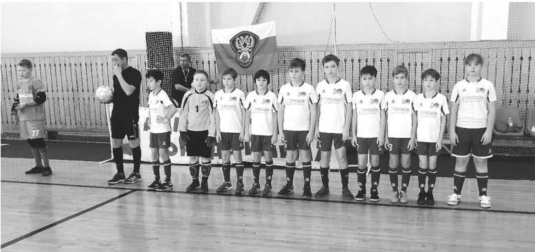
Команда голышмановских футболистов готова играть и выигрывать