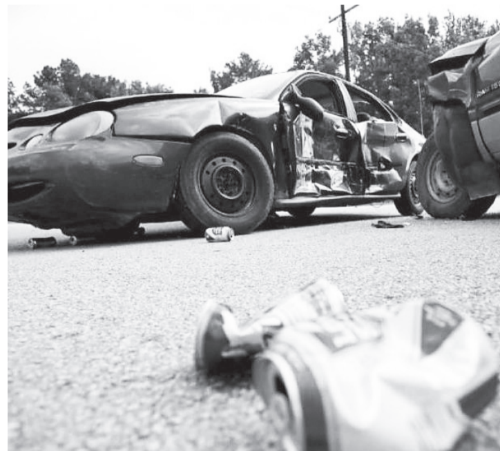
Прокуратура Упоровского района.

31.07.2019 г. Заводоуковский районный суд признал Ц. виновным в совершении преступления, предусмотренного ст. 264.1 УК РФ – управление автомобилем лицом, находящимся в состоянии опьянения, имеющим судимость за совершение преступления, предусмотренного ст. 264.1 УК РФ и по совокупности приговоров назначил наказание в виде лишения свободы сроком 1 год условно, с испытательным сроком 2 года, с лишением права управления транспортным средством на 3 года.