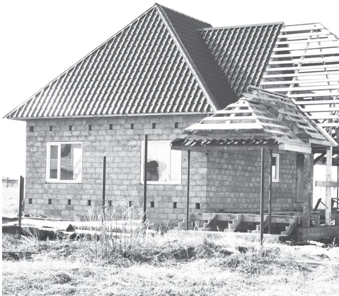
Стоит помнить, что сложные конструкции – это дополнительные расходы при строительстве.